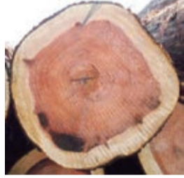
円のゆがみがある木材