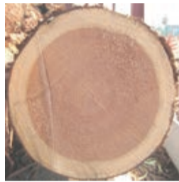
断面の美しい「とちぎ材」

栃木県は降雪が少なく一年を通じて気温・降雨のバランスが良いことから、良質な木が育ちます。木材が真っすぐで、丸太の断面がほぼ真円、中心部の偏りが小さいという特長も。見た目だけではなく、強度にも優れているため、建築材として高い評価を得ています。