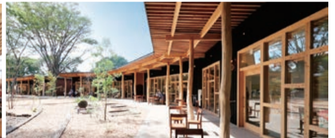
●写真上/とちぎ材をふんだんに使用した「栃木県林業大学校」。優れた強度と工夫を凝らした構造により、大空間を実現 ●写真左下/「道の駅ましこ」 ●写真右下/那須町の商業施設「GOOD NEWS NEIGHBORS」