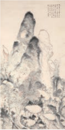
浦上玉堂《寒林閑處図》 岡山県立美術館蔵(大原コレクション)▶

本展では、玉堂の生誕地にある岡山県立美術館のコレクションに新たに加わった、倉敷の素封家・大原家の寄贈作品を関東で初公開します。