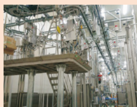
食肉処理施設の内部

また、様々な販売形態に対応できる部分肉の加工を行い、販路拡大につなげていきます。