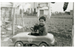
車の乗用玩具で遊ぶ子ども(昭和45年頃)