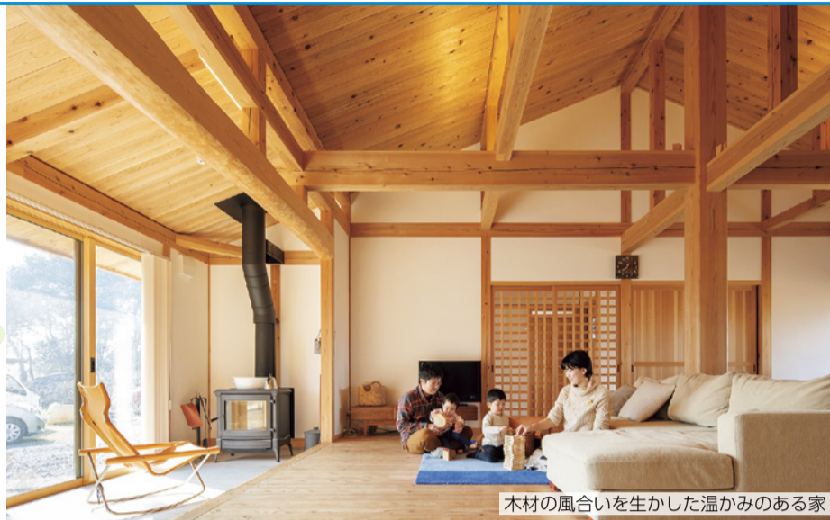
木材の風合いを生かした温かみのある家