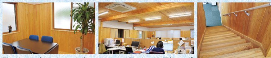
壁にサワラ、床にはヒノキを使った相談室 オフィスは壁にサワラ、天井にスギと、木に囲まれた空間に 階段にもスギを使用

木材を使わないのはもったいないですね。お客さんにも、木材は建材としてかなり可能性があるものだと、お薦めしています。