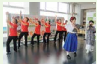
イベントでのダンスの披露