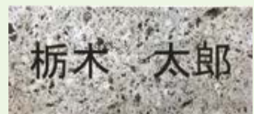
大谷石の銘板イメージ

●詳しくは いちご一会募金 検索 または県総務企画課 ☎028-623-3845