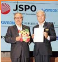
開催正式決定の様子

栃木県での国民体育大会の開催は、昭和55年の「栃の葉国体」以来42年ぶりとなります。また、全国障害者スポーツ大会の開催は今回が初めて。正式決定を受け、両大会に向けた機運が高まっています。