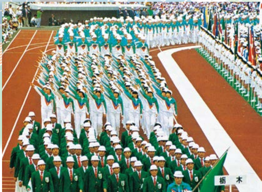
栃木県で前回開催された昭和55年「栃の葉国体」の様子

栃木県での冬季大会(スケート競技会・アイスホッケー競技会)の開催も決定しています。会期は令和4(2022)年1～2月を予定。