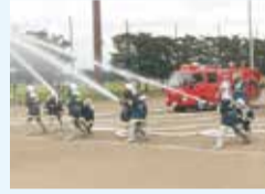
放水訓練を行う消防団