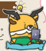
とも家事推進キャラクター「ともジカ」