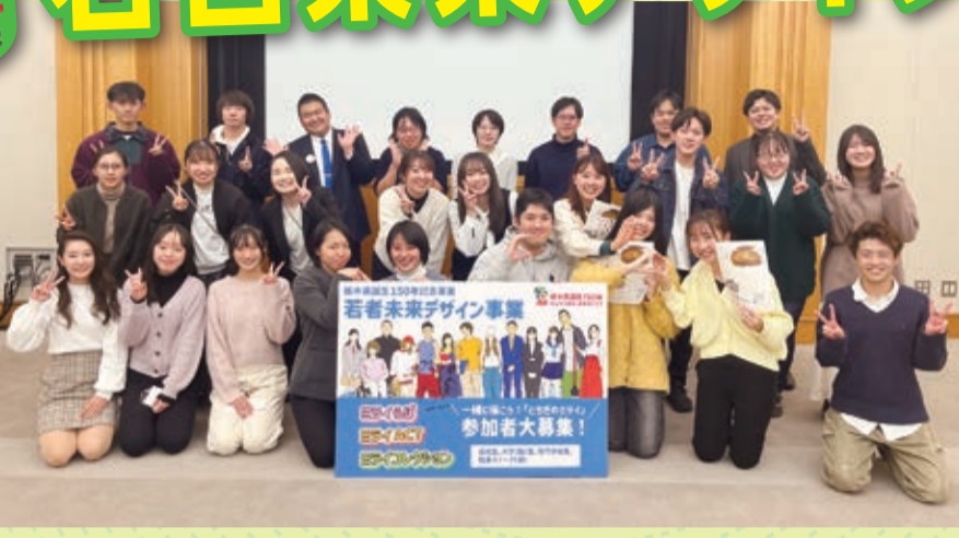
ミライらぼ参加の皆さん

“新しいとちぎづくり”の実現に向けて、総勢200名以上の若者(高校生~29歳)が、理想とするとちぎの将来像を描く「3つのプログラム」に半年にわたり取り組んできました。その成果を発表・披露します。