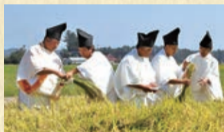
収穫の儀式「斎田抜穂の儀」

大粒で豊かな甘みがあり、炊飯後も粒がしっかりしているのが特徴です。粘りと弾力がおにぎりやお弁当にも最適。そのおいしさから、今の陛下の皇位継承に伴う儀式「大嘗祭」の献上米にも選ばれました。