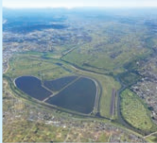
▲現在の渡良瀬遊水地

現在では、コウノトリをはじめとする野鳥が集まる貴重な動植物の生息地となっている他、スポーツやレクリエーションの場として親しまれています。