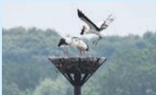
▲生息するコウノトリ