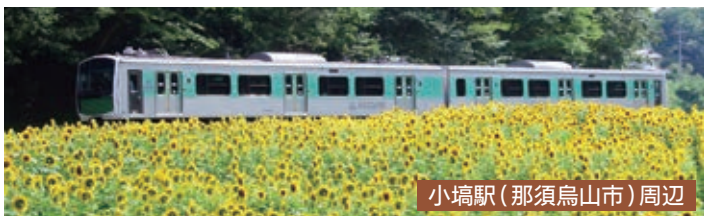
小埴駅(那須烏山市)周辺

地域住民の悲願から開通した JR 烏山線(宝積寺駅～烏山駅)。平成26年には国内初となる環境に配慮した蓄電池駆動電車「ACCUM(アキュム)」を導入するなど、“未来へつながる地域交通”としての役割を果たし続けています。