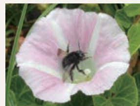
▲ハマヒルガオの蜜を食べる花粉を運ぶコマルハナバチ

会期:9/24(日)まで(休)月曜(9/18を除く)、9/19(火) 問同館(宇都宮市) ☎028-634-1312