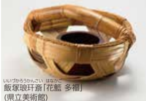
飯塚環珮斎「花籃 多福」(県立美術館)