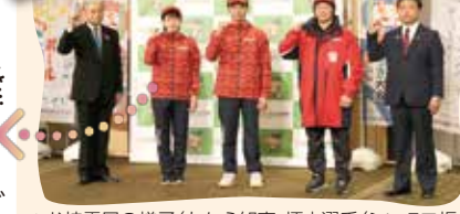
▲お披露目の様子(左から知事、榎本選手(シンクロ板飛び込み)、高杉選手(車いすバスケットボール)、古橋選手(H.C.栃木日光アイスバックス)、柳川日光市長)