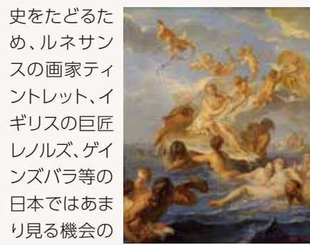
▲ノエル=ニコラ・コワペルの作品もご紹介「ヴィーナスの誕生」

本展では、その珠玉のコレクションから厳選した約80点の作品を展示。世界中の美術愛好者を魅了する、ルノワール、セザンヌ、ゴッホ、ゴーギャン、シャガール等の近代の人気作家に加え、それ以前の歴