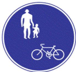
「普通自転車の歩道通行可」標識