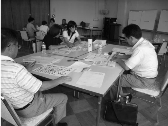
「やさしい日本語実践セミナー」における