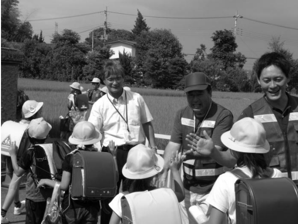
ハイタッチ運動の様子