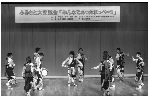
ふるさと大交流会の様子