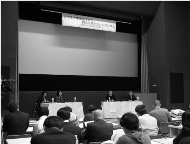
「大学生や中途退学者の悩みを考えるシンポジウム」の様子