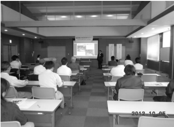
温泉熱の有効利用セミナーの様子