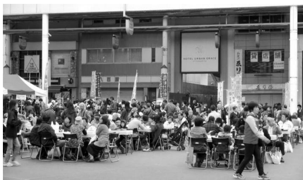
行ってみよう！食べてみよう！「とちぎ食の回廊」と「とちぎのふるさと田園風景百選」フェアの様子