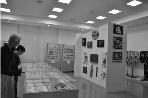
懐かしい”ふるさと とちぎ” 回想展の様子