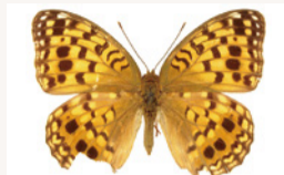
▲栃木県では絶滅した「オオウラギンヒョウモン」の県内産標本