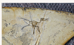
▲小型の翼竜「クテナカスマ」の全身骨格の化石

県立博物館開館以来40年近くにわたって収集された自然・人文両分野の収蔵資料の逸品を公開します。また、そもそも博物館は、どのような資料を、どのように収集し、保管し、活用しているのか紹介し、世代を超えて資料を引き継ぐことの大切さをお伝えします。