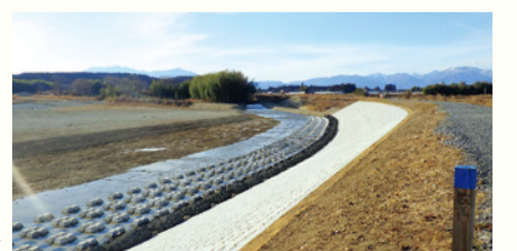
災害復旧した蛇尾川 町島大橋(大田原市)付近→