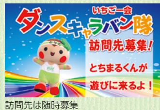
訪問先は随時募集

公式ホームページではイメージソング「いちご一会」と「いちご一会ダンス」を配信しています。10月からはダンスキャラバン隊の訪問活動も開始しました。とちまるくんと一緒に楽しく踊りませんか。