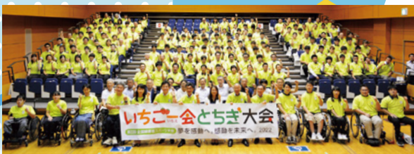
令和元(2019)年度栃木県強化指定選手任命式

全国的な障害者スポーツの祭典、第22回全国障害者スポーツ大会「いちご一会とちぎ大会」は、令和4(2022)年に栃木県で開催されます。新型コロナウイルスの影響により県内外の大会の中止が続く中、選手たちは日々練習に励んでいます。選手たちを応援し、障害者スポーツを盛り上げましょう。