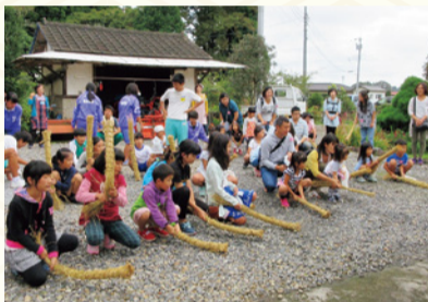
「ぼうじぼ」で地面を打つ子どもたち

旧暦の8月15日と9月13日に、美しい月を眺めながら秋の実りに感謝する月見。この日は、月の見える縁側に月見団子とススキ、季節の野菜や果物を供えるのが一般的です。本県ではそれに加え、子どもたちが近所の家を回りながら、「ぼうじぼ」「わらでっぼう」と呼ばれるわらで編んだ棒で地面を叩き、「大麦当たれ、小麦当たれ、三角畑のそば当たれ」などと豊作祈願の掛け声を上げます。地面を打つことによって、作物に害を与えるモグラを退治できるといわれ、ご褒美に家々からお菓子やお駄賃がもらえる、子どもたちにとってうれしい行事です。