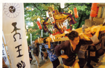
宇都宮二荒山神社天王祭

疫病退散を祈願して夏に行われる祭りで、病気の流行を防ぐため、みこしが荒々しく担ぎ回され、山車や屋台ばやしが出されるのが特徴です。県内でも夏祭りとして各地で行われていますが、祭られる神様によって、祭りの名称やみこしの担ぎ方が変わるなど、地域による違いも見られます。