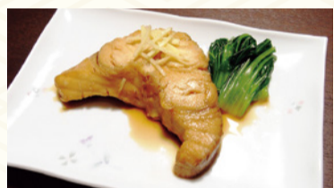
サガンボの煮付け

サガンボはアブラツノザメ、モロはネズミザメのこと。煮付けにするのが一般的ですが、学校給食でフライなどにして提供されることもあります。サメは、時間が経つと体内にある尿素がアンモニアに変化するため、腐りにくく保存性が高い魚です。冷蔵庫がなかった時代に、本県では貴重な海の魚として流通し、とちぎならではの味となりました。