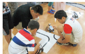
ロボット操作を体験しよう講座/足利大学