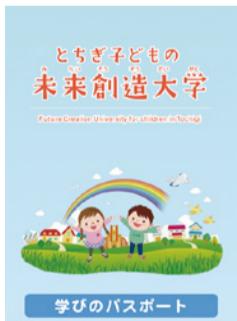
学びのパスポート

講座を一つ受けると1単位を取得することができ、「単位シール」が一枚もらえます。これを、最初の講座で受け取る「学びのパスポート」に貼っていきます。