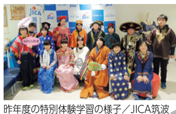
昨年度の特別体験学習の様子/JICA筑波