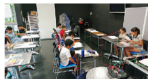
ラジオ番組はどのように作られるのかな/RADIO BERRY