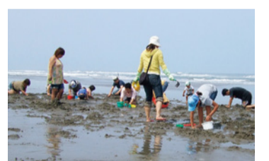
毎年家族連れでにぎわうハマグリまつり(大竹海岸)

大竹海岸(鉾田市)では、5/6(月・振休)まで旬の鹿島灘産のハマグリが大量に放流される「ハマグリまつり」を開催! このイベントでは、何とハマグリが採り放題(有料)。皆さん奮ってご参加ください。