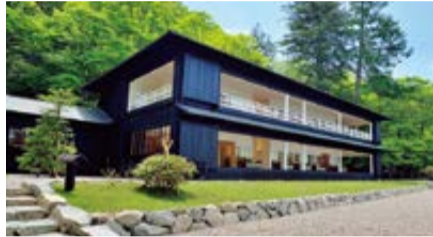
英国大使館別荘記念公園 問 県自然環境課 ☎028-623-3211

●5/14(火)～7/31(水) ●かつて皇室や欧米の外交官などの「プレミアムリゾート」として栄えた日光で、旧御用邸や旧大使館別荘を巡るスタンプラリーなどのイベントを開催 ●スタンプ設置施設:日光田母沢御用邸記念公園、英国大使館別荘記念公園、イタリア大使館別荘記念公園、中禅寺湖畔ポートハウス、金谷ホテル歴史館、JR日光駅、東武日光駅 ●詳しくは問い合わせを