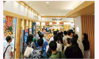
6周年イベントの様子