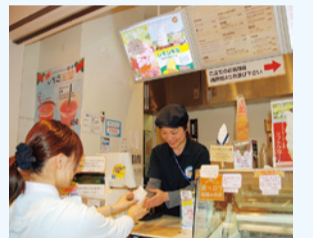
テイクアウトもできます