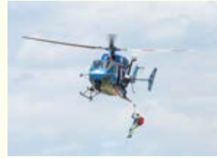
防災ヘリによる救助訓練