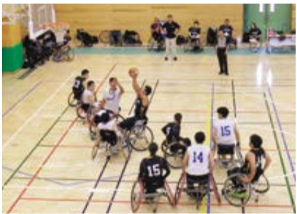
問 栃木県障害者スポーツ協会 ☎028-624-2761 FAX 028-624-2761

●9/22(日)午前8時30分～午後3時 ●栃木市総合運動公園ほか ●対象:県内在住で12歳以上の身体障害者・知的障害者・精神障害者定約2,000名 ●申込期間:5/9(木)～30(木) ●応募方法などはお住まいの市町の障害福祉担当課または所属する学校・施設等へ問い合わせを