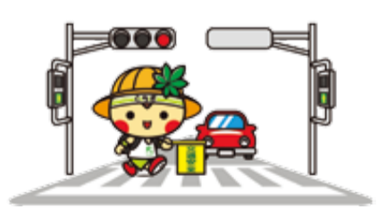
問 県暮らし安全安心課 ☎028-623-2185

●5/11(土)～20(月) ●スローガン:マナーアップ!あなたが主役です ●栃木県重点:「子どもや高齢者に優しい3S(スリーエス)運動」の推進、「夜間走行中の原則ハイビーム」の徹底 ●交通ルールを守り、正しい交通マナーを実践して交通事故を防止しましょう