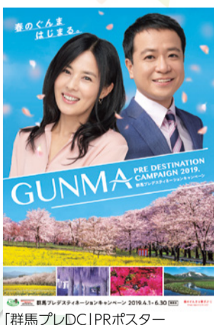
「群馬プレDC」PRポスター