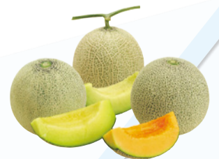
口の中で、幸せな甘さが広がる茨城のメロン

茨城県は、メロン生産量が日本一! 一大産地である鉾田市では、まるやかで上品な甘みの「クインシー」や、肉厚で、香り・甘みともに豊かな「アンデス」、香り高く、きめ細かいジューシーな果肉が特徴の茨城オリジナルメロン「イバラキング」などを栽培しています。