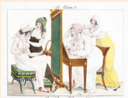
『化粧(No.5)』(ラ・メザンジェール編『ボン・ジャンル』より【1827年刊(1817年初版)】)

本展では、イギリスとフランスを中心とした、近代西洋から現代日本までの美術作品を取り上げ、そこに現れたファッションについて、同館の所蔵品を中心にご紹介。春から夏へと季節が移り変わる衣替えの季節に、画中の人々の服を着る・脱ぐ行為や、身体と服の関係性に注目し、作品の中のファッションが持つ物語をひも解きます。