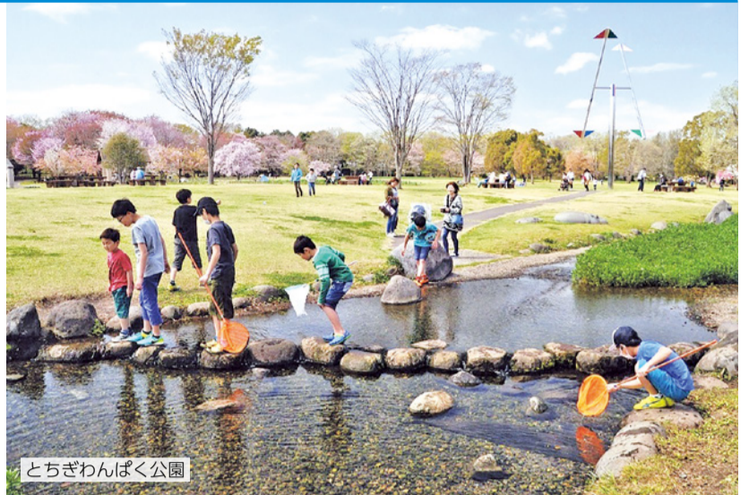
とちぎわんぱく公園

とちぎわんぱく公園 イメージキャラクター ピッピーとピコ ©1998スタジオジブリ