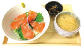
ヤシオマス丼のセット

店内奥にはイートインコーナーがあり、ヤシオマスや日光ゆばなどの県産食材を使用したメニューのほか、地酒やワインなども提供しています。とちおとめミルクジェラートやいもフライなども人気商品です。