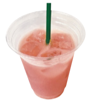
スカイベリー甘酒

農産物の生産から加工、流通・販売までを一貫して行う「農業の6次産業化」の取り組みを応援しています。県産農産物を使用した多彩な商品をメニューに取りそろえ、店頭で試食販売を行うなど、6次産業化商品の魅力を発信しています。