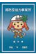
事業所に交付される表示証

県では、消防団活動に積極的に協力している事業所等について、広く県民に紹介し、消防団活動への理解を深めてもらうため、要件を満たす事業所等に対して「栃木県消防団協力事業所表示証」を交付し、優良事業所として認定しています。