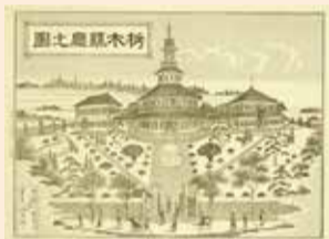
移転された栃木県庁舎の図

***** 会期:2/23(土)~4/7(日) 月曜 問 同館(宇都宮市) ☎028-634-1312 *****