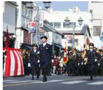
消防団の分列行進

市町村ごとに要件は異なりますが、一般的に18歳以上の方ならどなたでも入団できます。団員各自の能力に応じて役割が分担されるので、男女問わず幅広い年代の方が活躍しています。女性消防団員は、防火訪問や防災教育などの広報活動、応急手当の指導普及などで活躍しているほか、大学生や専門学校生などの若い世代の方も入団しています。