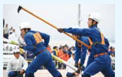
火点(標的)への放水の様子

栃木県代表として史上初の優勝で、関東地方勢としては昭和59年の千葉県の優勝以来の快挙です。