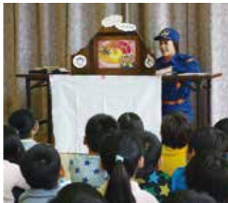
女性消防団員による防災教育