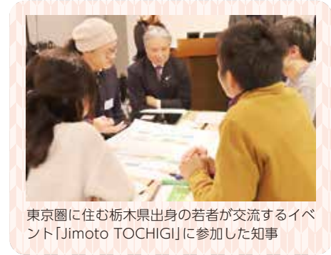
東京圏に住む栃木県出身の若者が交流するイベント「Jimoto TOCHIGI」に参加した知事

知事 若者たちの議論の場に加わって参りました。「とちぎが好きだ、戻って暮らしたい」という雰囲気伝わってきて、頼もしく思いました。参加者が将来、地元に戻ること、これからのとちぎを活性化してくれることに期待しましたね。