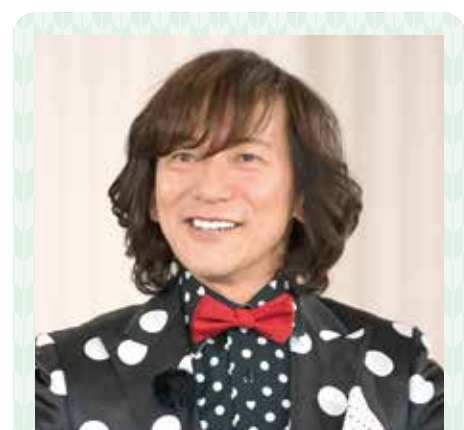
ダイヤモンド☆ユカイさん ロックバンド「レッドウォーリアーズ」のボーカルとしてデビューし、現在も音楽活動を中心に幅広く活躍中。長女の誕生を機に佐野市へ移住

ユカイ 俺が移住する時にも、そういうイベントがあったら良かったなあ。うらやましいな。