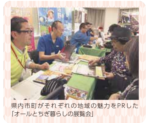
県内市町がそれぞれの地域の魅力をPRした「オールとちぎ暮らしの展覧会」

知事 そうですね。栃木県ではその促進のため、東京のJR有楽町駅前に「とちぎ暮らし・しごと支援センター」を設置し、暮らしと仕事の相談にワンストップできめ細やかに対応しています。また、昨年10月には、県内全市町等と協力して、移住に役立つ相談ブースの設置や、先輩移住者のトークライブなど、盛りだくさんの企画を用意した「オールとちぎ暮らしの展覧会」も開催し、とちぎへの移住に興味・関心のある多くの方にきていただきました。このような取り組みにより、とちぎでの暮らしを具体的にイメージしてもらえよう、引き続き情報発信をしていきたいと思っています。