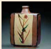
濱田庄司「柿軸赤絵扁壺(かきゆうあかえへんこ)」1971年[栃木県立美術館蔵]

本展では、栃木県ゆかりの工芸を中心に人間国宝の作品をはじめとする優品約70点を展示。さらに素材や技法に焦点を当て、図面や石こう型、制作工程見本なども紹介します。