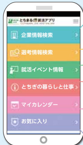
アプリのホーム画面

県では、「とちぎ」での就職活動を支援するためのアプリケーションを開発しています。「知りたい」に伝わる情報が盛りだくさん。ぜひご活用ください。