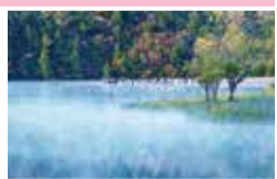
昨年度「会長賞」受賞作品

●テーマ: ~奥日光~山と水の織りなす景色 ☎11/30(金) ●応募方法などは問い合わせを ☎県環境保全課☎028-623-3189