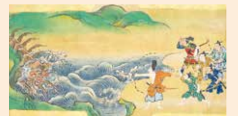
大ムカデと戦う藤原太と藤原秀郷 「三井寺物語絵巻」上巻(部分)より(唐澤山神社蔵)

～ハロウィンスペシャル&収穫祭～ とちぎ花センター(栃木市) ☎0282-55-5775 ●巨大おばけカボチャなどで園内をハロウィン風に装飾 ●10/28(日)まで ※鑑賞大温室入館料:大人400円、子ども200円