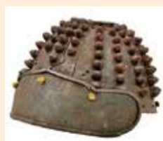
藤原秀郷の末裔(えい)が着用したとされる平安時代のかぶと(唐澤山神社蔵)

秀郷の子孫には、平泉の奥州藤原氏や歌人・西行を生んだ紀伊佐藤氏をはじめ、下野でも小山氏・長沼氏(のちの皆川氏)・佐野氏・小野寺氏などの有力武士団が生まれました。このように、全国に広がった秀郷流武士団はまさに「源平と並ぶ名門武士団」と称しても過言ではありません。