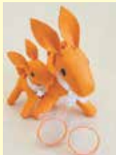
認知症サポーターキャラバンマスコット「ロバ隊長」と「オレンジリング」

A 県・市町では、地域で暮らす認知症の人やその家族を応援する「認知症サポーター」を養成しています。サポーターには「オレンジリング」を差し上げています。(県内で約180,000人養成(H30.6月末現在))