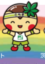
茨城県のマスコット「ハッスル黄門」

栃木、茨城、群馬の3県は、北関東自動車道でダイレクトに結ばれています。今年の夏は、お隣の県にも出掛けてみませんか。