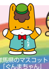
群馬県のマスコット「ぐんまちゃん」