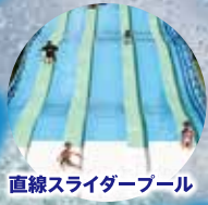
直線スライダープール