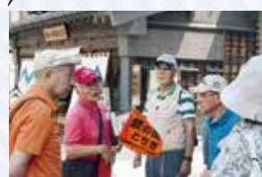
距離感の近いガイドが信条

ガイドするときは、「一緒に楽しむ」ことを心掛けています。終わった後、お礼の言葉や手紙をいただけることがあります。中には「またお願いしたい」と言ってくれる人もいて、そういう時に「気持ち伝わった、やって良かった」と思えて、やりがいを感じます。