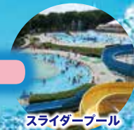
スライダープール