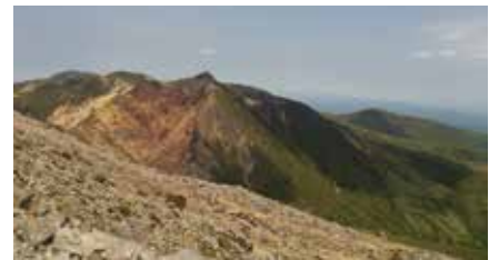
問 栃木県「山の日」協議会事務局(県自然環境課内) ☎028-623-3206

●8/19(日) 午前8時30分～午後3時30分 ●なす高原自然の家、那須岳 ●登山を通じて山の魅力と安全を家族で学びます ●対象：小中学生の親子 定 90名(先着) 料 1,000円 7/31(火) ●申込方法などは県ホームページで確認を