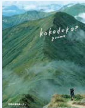
ぐんま県境稜線トレイル