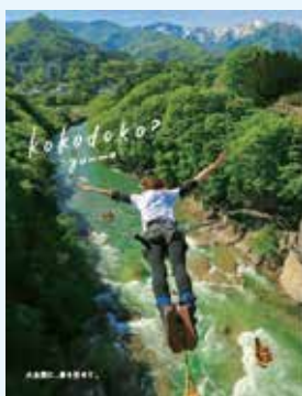
バンジージャンプ(みなかみ町)