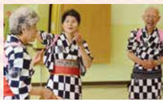
仲間との練習はいつも笑顔

周りに相談できる仲間がいることで、新しいことを始める時の苦労は全然違います。だから、自分のことを理解して、同じ目標に向かって協力してくれる仲間を見つけることが何より大切だと思います。