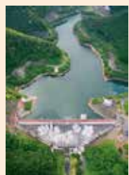
クラウス・ダオフェン「HA NAZAKARI 花ざかり」2008年