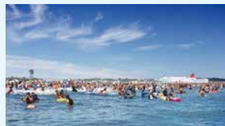
毎年大にぎわいの大洗サンビーチ海水浴場

茨城県内最大の「大洗サンビーチ海水浴場(大洗町)」は、宇都宮から北関東自動車道で約1時間とアクセス良好です。他にも、波が穏やかで家族連れに人気の「平磯海水浴場(ひたちなか市)」や、サーフィンに最適な「波崎海水浴場(神栖市)」など、