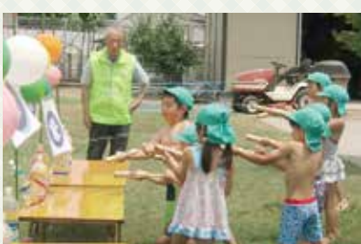
「水鉄砲」での的当ては毎年人気