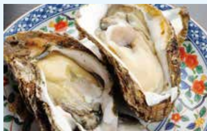
身が厚くクリーミーな味わいの岩ガキ

バラエティ豊かな海水浴場がそろるのが茨城県の魅力です。さらに、海上花火大会や夜の海を舞台としたイベントなど、一日を通して、いばらきの海を満喫できます。