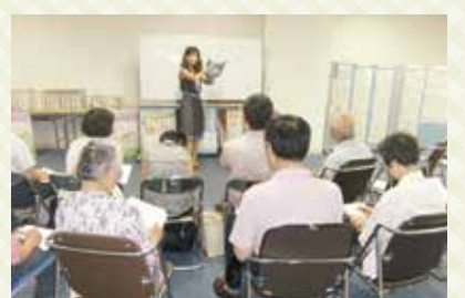
シニアセミナーの様子

とちぎ生涯現役シニア応援センター(ぷらっと)は、県が設置したシニアの社会参加活動を応援するための施設です。社会貢献活動から就労まで、利用者の希望に応じた活躍の場を探すための相談に応じているほか、シニアセミナーも開催していますので、「ぷらっと」お気軽にご利用ください。