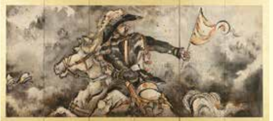
「富士見西郷図屏風」左隻

その人物とは、足利藩士で、幕末に尊皇志士と交流し、足利藩を尊皇に導いたとされる文人画家「田崎草雲」。彼は、西南戦争の指揮を執る隆盛を、二角帽子と洋装の軍服を身にまとい、白馬に