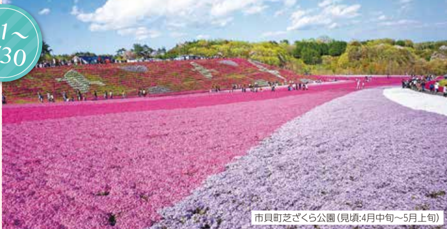
市貝町芝ざくら公園(見頃:4月中旬~5月上旬)

JRグループ6社と地域が協働で取り組む大型観光企画「デスティネーションキャンペーン(DC)」がいよいよ開幕します。4月から6月までの期間中は、たくさんのイベントが開催されます。とちぎ県民だより3月号に続き、今回は、エリアごとの観光企画をご紹介します。皆さんも、春のとちぎ旅を満喫してみませんか。