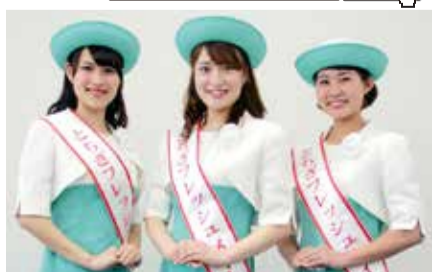
平成29年度とちぎフレッシュメイト 問 とちぎ農産物マーケティング協会 ☎028-616-8787