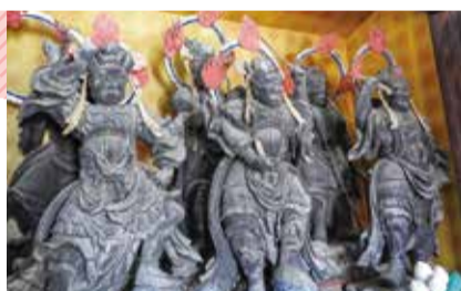
「十二神将像」[興生寺(壬生町)蔵]