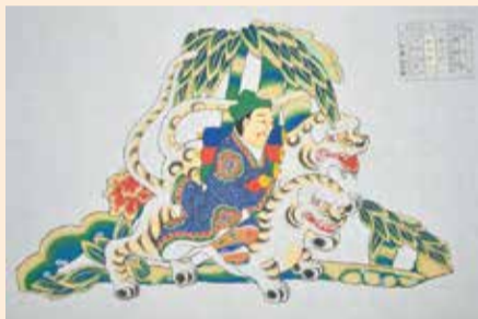
見取図「鄭思遠」(日光社寺文化財保存会蔵)

各作品を通じて、古くから受け継がれてきた「とちぎの匠の技」の魅力を感じてみてください。