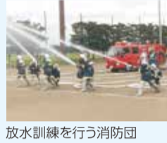
放水訓練を行う消防団