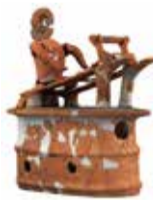
「機織型埴輪」[しもつけ風土記の丘資料館(下野市)蔵]