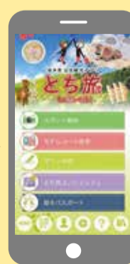
「とち旅」トップ画面

4月1日から、より身軽で便利な、電子版「栃木パスポート」がスタートしました。栃木県公式観光アプリケーション「とち旅」内からご利用いただけます。アプリは、下記QRコードからダウンロードできます。スタンプは、おもてなし施設に設置されているQRコードをこのアプリを使って読み取ることで取得できます。また、エリア別におもてなし施設を検索することもできますので、ぜひご活用ください!詳しくは 栃木パスポート 検索