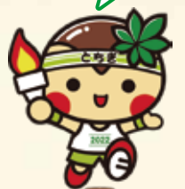
大会マスコット とちまるくん(国体版)