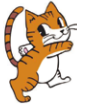
同センターキャラクター「あいちゃん」

●2/25(日)午後1時30分~3時●「猫とずっと幸せに暮らすために~猫の心理から飼い方を見つめ直す~」をテーマとした講習会定80名(先着)料無料●申込期間:2/5(月)~16(金)●電話で申し込みを 問同センター☎028-684-5458