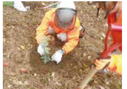
森林の若返りを図るために必要な植栽

伐採後の植栽や、シカやクマなどの野生獣から樹木を守るための防除対策、多くの人々が利用する施設の木造・木質化などを支援します。