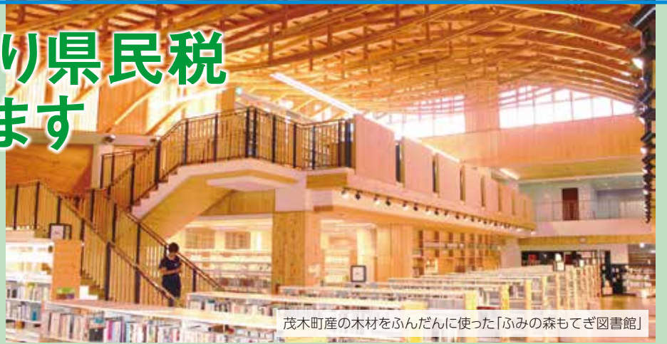
茂木町産の木材をふんだんに使った「ふみの森もてぎ図書館」

私たちに多くの恵みをもたらしてくれる森林を、元気な姿で次の世代に引き継ぐため、県では、平成20年度から「とちぎの元気な森づくり県民税」を導入し、荒廃した森林の整備などに取り組んできました。しかし、本県の森林・林業は、現在、森林の高齢化などの課題を抱えており、早急に対応する必要があることから、課税期間を平成30年度から10年間延長することとしましたので、ご理解・ご協力をお願いします。