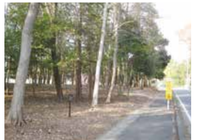
整備された里山林(野木町)

手入れのできない針葉樹林を管理の容易な広葉樹林などに転換するほか、身近な里山林の保全などを支援します。