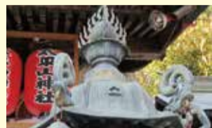
灯籠の中央に施された猪目