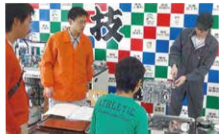
自動車のエンジン分解のデモンストレーション

●9/9(土)午前10時~午後3時●同校(宇都宮市)●学生によるデモンストレーション、各科指導員による講座(車のトラブル対処法など)、ものづくり体験(LEDハロウィンランタン作りなど)、模擬店など●当日直接会場へ