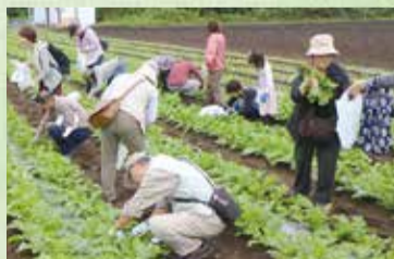
農家での農業体験

近年、農村地域活性化の取り組みの一つとして注目を集める「グリーン・ツーリズム」。農村地域ならではの体験を通じて、人や自然との触れ合いを楽しむ旅のことです。