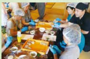
収穫した野菜を使った料理体験

県では、農村地域の魅力ある体験交流プログラムを企画する人材の養成に取り組むなど、本県ならではのグリーン・ツーリズムづくりを推進しています。