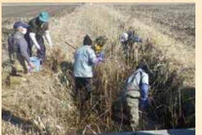
隊員も協力して行われた用水路の環境保全活動

県では今後、必要な行政情報の提供や隊員同士の交流会を行い、各隊員がそれぞれの地域でさらなる活躍ができるように、隊員間のネットワークづくりを推進していきます。