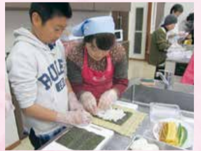
かんぴょうを使った太巻き作りを行う料理教室

「農村地域に多くの女性が活躍できる場をつくりたかった」という思いもあって、スタッフのほとんどが女性。中には、調理師や管理栄養士などおいて、そうしたスタッフと一緒に、味と健康にこだわって作る商品は大人気です。また、地域で行われるお祭りへの協力や、見守りを兼ねた高齢者へのお弁当の宅配などを通じて、地域コミュニティの維持にも貢献しています。