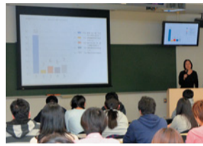
前回のセミナーの様子

●12/17(土)午後1時30分~3時30分 ●宇都宮大学峰キャンパス(宇都宮市) ●対象:県内在住の10代後半~20代 ●早稲田大学森川友義教授による“恋愛学”入門講座、宇都宮大学演劇研究会によるライフデザインをテーマにした寸劇 120名(抽選) 無料 12/8(木) ●申込方法などは問い合わせを 問 下野新聞社クロスメディア推進部 028-625-5333