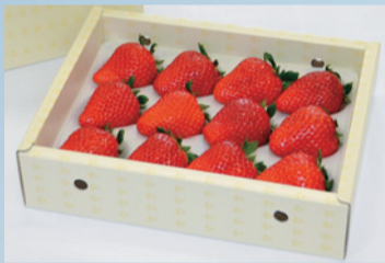
包装も高級感があり贈り物に最適

そんなスカイベリーは、クリスマスやお誕生日をはじめ、特別な日の贈り物にぴったり。目を奪われる大きさとプレミアムなおいしさに、笑顔になること間違いなしです。ぜひ、大切な方にプレゼントしてみませんか。