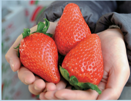
大人が持っててもこの大きさ

17年の歳月をかけ、10万を超える株の中から選抜された奇跡のいちご「スカイベリー」。大粒で美しい円すい形が特徴で、その大きさは、一口では食べきれないほど。酸味が少なく甘さが際立っており、まるでスイーツを食べているかのような味わい的高级いちごです。