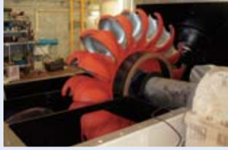
水力発電に使用されるペルトン水車

また、再生可能エネルギーである水力を利用した発電は、CO 2 排出が少なく、環境負荷の低減にも貢献しています。