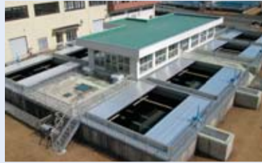
水をきれいにする急速ろ過池

北那須・鬼怒の2つの水道事務所から、宇都宮市や大田原市などに、365日24時間、安全安心な水道水を供給しています。