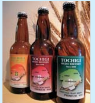
県産のビール麦や果物を使った季節限定ビール