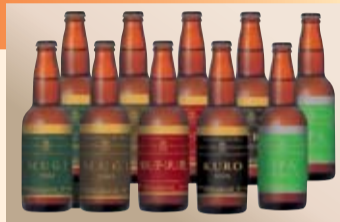
こだわりのビールの数々

「ろまんちっく村クラフトブルワリー」では、季節限定ものを含めて、年間約10種類のビールを製造しています。中でも、看板商品の「麦太郎」と「麦次郎」は、宇都宮産ビール麦を100%使用。このビール麦は、県農業試験場で開発された「サチホゴールド」という品種で、雑味が少ないビールができる優れたものです。