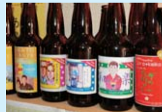
オーダーメイドで醸造されたビール