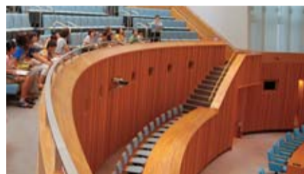
昨年度の様子(議会議事堂見学)

●8/18(木) 午後1時30分～3時 ●見学場所(予定)：1階県政展示コーナー、15階展望ロビー、議会議事堂、知事応接室(特別見学) ●対象：県内に在住する小学3～6年生とその保護者 10組最大30名(保護者1名につき対象児童2名まで、先着) 料 無料 ●7/4(月) 午前9時から受け付け開始 ●電話で申し込みを