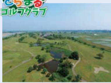
池やバンカーを巧みに配置したゴルフ場