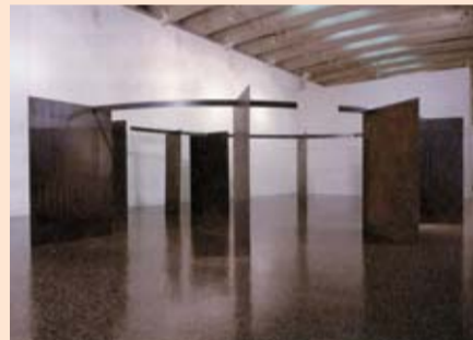
「特異な空間へ」1984年 東京国立近代美術館蔵

1970年代の「グループ361」のパフォーマンス写真など、約80点で構成した、高木修という美術家の全貌を初めて紹介する企画展です。