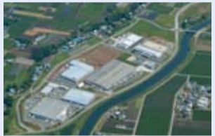
分譲中の大和田産業団地

本県が有する交通の利便性や大規模災害が比較的少ない特性などを生かし、成長力に富んだ企業の誘致を進めるため、産業団地の整備を行っています。