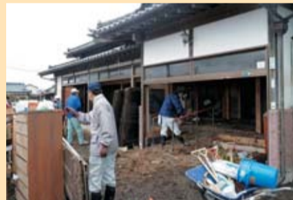
東日本大震災による被災地(南相馬市)で津波被害を受けた家屋の泥出し作業