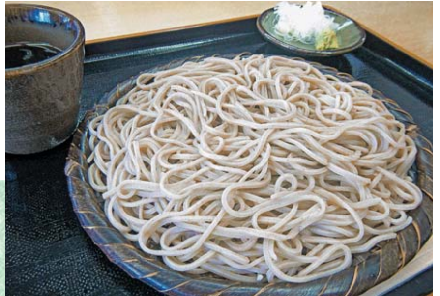
八溝そば街道の加盟店の情報などは 同 同街道推進協議会 ☎0287-83-1231

県では、地域のおいしい「食」をテーマに、街道と景観や歴史、文化などを結び付けた多彩な「食の街道」をつくり、「とちぎ食の回廊」としてその魅力を全国に発信しています。今回は、その街道の中から「八溝そば街道」を取り上げてご紹介します。