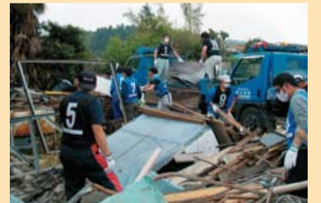
平成24年5月6日に県東部を襲った竜巻・突風による被災現場での復旧活動