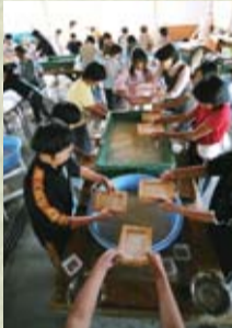
そば打ち体験(左)と和紙手すき体験

八溝そば街道に加盟しているそば店の中には、そば打ち体験を実施しているところがあります。プロの打ったそばがおいしいのはもちろんですが、自分で打ったふぞろいのそばも、最高の味わいです。また、この街道には「烏山和紙」の手すき体験(那須烏山市)や、「小砂焼」の陶芸体験(那珂川町)が行える施設などもあります。