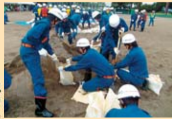
水防演習(土のう作り)