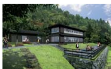
復元後の外観イメージ