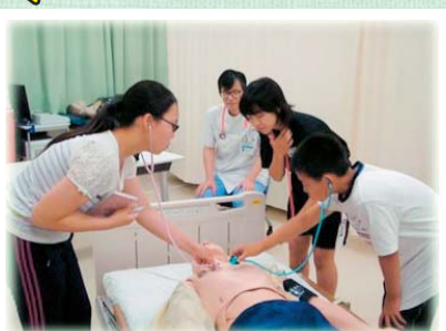
医師・看護師の模擬体験/自治医科大学