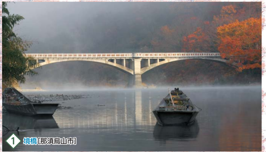
1 境橋 [那須烏山市]

毎日通る道路や橋、発電施設・防災施設などは、土木事業によって造られ、安全に利用できるよう維持・管理されています。特に、幕末以降、西洋の近代土木技術が導入されてから第二次世界大戦までに造られ、現存しているものを“近代土木遺産”と呼びますが、その価値はあまり知られていないかもしれません。あなたの身近にある土木遺産に目を向けてみませんか。