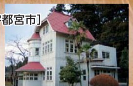
①今市浄水場旧管理棟

戸祭配水場は現役で稼働している施設で、配水池の側面は12連のアーチが美しく連続するフランス積み煉瓦造り。今市浄水場との標高差は240メートルもあり、浄水場で処理された水を送水する際に送水管にかかる水圧を調整するための接合井が6カ所設置されました。送水先の変更により役目を終えた日光街道沿いの第六号接合井は、現在も創設時の姿のまま残されており、赤煉瓦と地元産大谷石を使用した八角形の建屋を見ることができます。