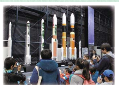
特別体験学習/筑波宇宙センター ※今年度の行き先はホームページでお知らせします