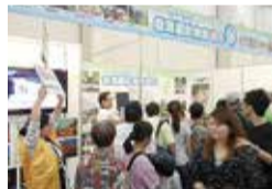
台湾で行われた国際旅行博の栃木県ブース

増加が見込まれる東アジア、東南アジア諸国からの観光誘客のため、国際旅行博や台湾でのトップセールスなどにより、本県の魅力をPRします。