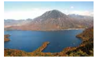
男体山と中禅寺湖

郷土愛の醸成を図るとともに、本県の魅力・実力を発信し人をひきつけ“選ばれとちぎ”としていくために「新とちぎ百選(仮称)」を活用し、小中学校で使用する冊子や県内外に広くPRするためのホームページ等を作成します。