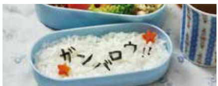
結婚部門 最優秀賞「お弁当」 ☎県子ども政策課☎028-623-3068

●受賞作品12点をまとめた「幸せエピソード集」の配布も行っています。配布場所などは問い合わせを