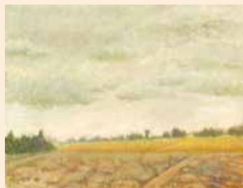
「駒生あたり」1970-80年代 個人蔵

昭和25年には妻の実家のある宇都宮に移り、自ら設計したアトリエで後半生を過ごしました。25年以上にわたってほぼ毎年、作品を自由美術展に出品する傍ら、絵画研究所を主宰し生徒を指導するほか研究所で展覧会を主催するなど、地方都市での文化活動を支えました。しかし公的な職に就くことはなく、生涯画家を職業としました。経済的な困難の中にあっても制作を続けたこの頃は、身辺雑記のような作品から生命への慈しみにあふれる大作まで、多様な作品が生まれています。本展では、そんな彼の画業を油彩・水彩・素描約120点により紹介します。