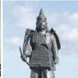
新田義貞像(東武鉄道太田駅前)