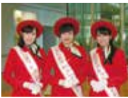
平成26年度とちぎフレッシュメイト

●県内外のイベント(年間約40回)で、とちぎブランド農産物のイメージアップ活動を行います●応募資格:県内に在住する18歳~29歳の方☎若干名(選考)☎4/30(木)必着●応募方法などは問い合わせを。またはフレッシュメイト募集 ☎とちぎ農産物マーケティング協会 ☎028-626-2150