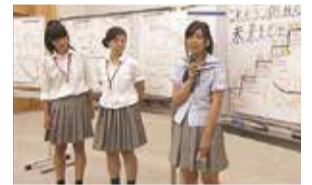
「未来のじぶん」について発表する高校生

やがて親となる若者が、家族や地域社会などについて主体的に学ぶことにより、地域を支える心を育む「じぶん未来学」(平成28年度から全ての県立高校等で実施予定)のプログラム開発を行います。