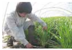
全国第2位の生産量を誇るにら

競争力を備えた強い園芸産地を育成するため、いちご、トマト、にら、アスパラガスなどの生産力強化や、その他の園芸作物の産地育成に取り組みます。