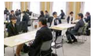
学生を対象とした就職面接会

県外大学等との就職促進協定の締結や、首都圏における就職ガイダンスの開催などにより、学生の県内就職を促進します。