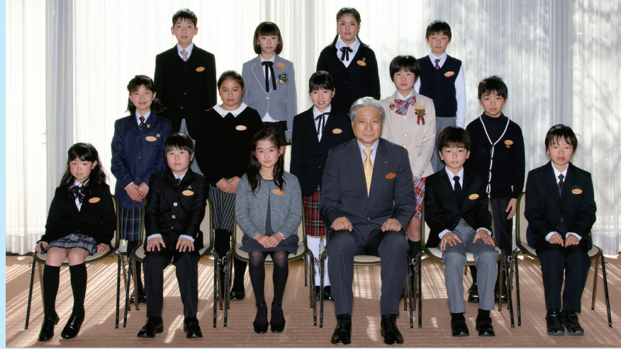
受賞者15名が作文を発表「とちぎの未来へ～ジュニア知事さんからのメッセージ～」とちぎテレビ 1/26(月)～28(水) ※3日連続 午後5時45分～6時

「もし私が知事になったらこんなことをしてみたい」というテーマで小学校4、5、6年生から作文を募集した「ジュニア知事さん」の表彰式を、12月19日に県公館で行いました。1,796名の応募の中から15名が知事賞を受賞しました。ふるさと“とちぎ”をもっと元気にしたいという熱い思いにあふれた提案がたくさん寄せられました。