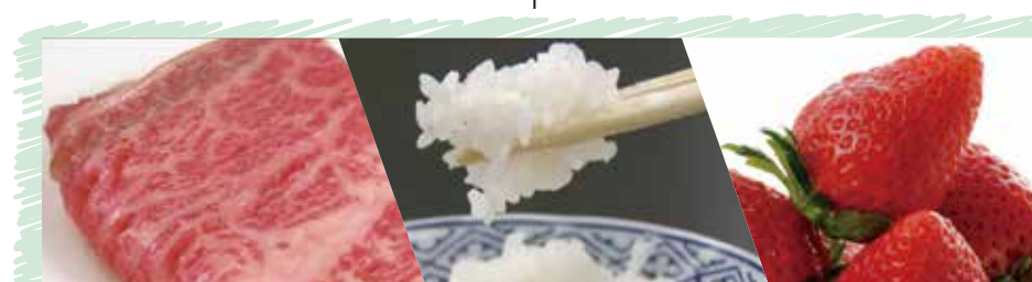
リーディングブランドの「とちぎ和牛」「なすひかり」「スカイベリー」