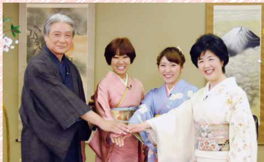
対談をテレビで放送します とちぎテレビ「新春知事対談～女性が輝く元気なとちぎ～」(再)1月3日(土)午後8時～8時30分

知事 県でも栃木県女性活躍推進会議を設けて、現場で活躍する女性の皆さんからさまざまなご意見をいただきました。