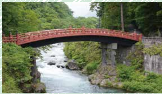
朱塗りの神橋。世界遺産「日光の社寺」の玄関口に位置する

根本 日光には雄大な自然と世界遺産があります。また、パワースポットでもあるのでいい所だなと思いますね。お客さまが「神橋まで来ると空気が違う」と言ってくれます。