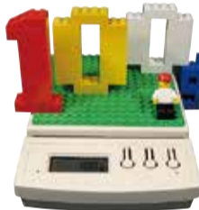
作品名:100g Toy #2

●9/23(火・祝)午後2時～ ●企画展開催中のタムラサトル(1972年、小山市生まれ)は、国内の美術館のみならず、欧州、米国の展覧会などで活躍する栃木県を代表する世界的アーティスト! 作家本人によるアーティスト・トークを企画展示室にて開催します(企画展観覧料が必要)