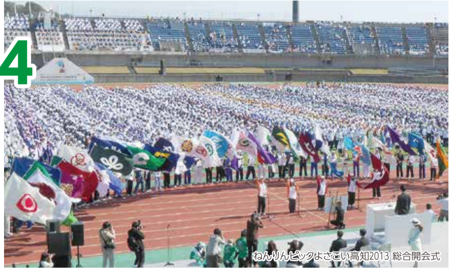
ねんりんピックはさこい高知2013 総合開会式

10月4日(土)から7日(火)まで、本県で開催するねんりんピック(全国健康福祉祭)は、60歳以上の方々を中心とするスポーツ、文化、健康と福祉の祭典です。全国から集まった選手たちが、日ごろ鍛えた技を競い合うスポーツと文化の交流大会に加え、あらゆる世代の人たちが楽しめるイベントも開催します。