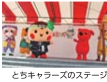
とちキャラーズのステージ

県北地域ならではの「大田原一太鼓」や「那須野ヶ原疏水太鼓」といった郷土芸能や、素敵な賞品が当たるゲーム大会、県内のゆるキャラが大集合する「とちキャラーズ」のステージなど盛りだくさんの内容です。