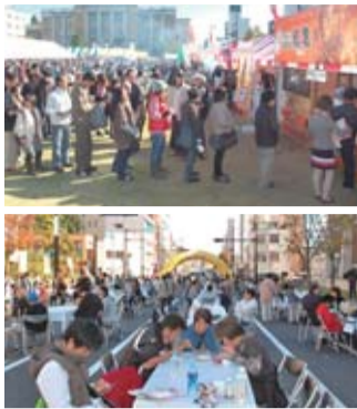
大勢の人でにぎわった昨年のとちぎ元気グルメまつり

さらに、県内のゆるキャラ®たちと遊べる「ゆるキャラ広場」や、県北地域の魅力が満載の「那須野が原元気ストリート」なども設置しイベントを盛り上げます。ぜひご来場いただき、栃木県、そして県北地域の“元気”を感じてください。