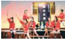
那須野ヶ原疏水太鼓