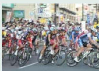
昨年のジャパンカップ(クリテリウム)

見どころ 時速40kmを超える自転車とは思えないほどのスピード感、選手達とともに通り過ぎる風を感じることができます。特にクリテリウム(市街地や公園内の周回コースで行われるサイクルロードレース)では、選手達を何度も間近に見ることができます。 地域貢献 「少しでも交通事故を減少させたい」、「子どもたちの命を守りたい」という思いから、幼児から高校生までを対象とした自転車安全教室やサイクルマナー向上のためのサイクルイベントなどを行っています。 お知らせ 10/18(金)~20(日)に宇都宮市内でアジア最高峰のレース「ジャパンカップ2013」が開催されます。19日(土)に行われる大通りを会場としたクリテリウムは必見! 問 サイクルスポートマネジメント(株) ☎028-643-6626