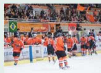
ファンから送られる熱い声援

見どころ アイスホッケーは選手同士の接触が許されており、そのぶつかり合う激しさから「氷上の格闘技」とも呼ばれています。時速30~40kmで氷上を選手が滑り、飛び交うパック(球技におけるボールに相当するもの)のスピードは時速160kmを超えます。 地域貢献 選手達が学校を訪問し、小中学生に夢を持つ大切さ、夢を叶えるためのアドバイスなどを体験を通して伝える活動や、地域の小学生や福祉施設の方を試合に招待する活動などを行っています。 お知らせ 年内開催のホームゲーム 10/6(日)・8(火)、11/1(金)・2(土)、21(木)・23(土)・24(日)、12/7(土)・8(日) いずれも会場は日光霧降アイスアリーナ 問 (株)栃木ユナイテッド ☎0288-53-5166