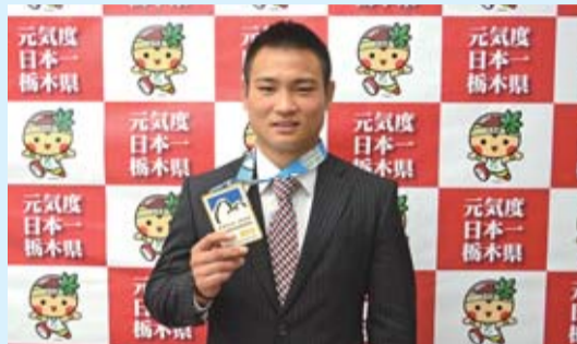
第31回世界柔道選手権大会(リオデジャネイロ)において、男子個人戦66kg級で金メダルを獲得した海老沼匡選手(10月2日)「東京オリンピックに出場し金メダルを獲って、多くの方に恩返しをしたい」と決意を述べていました。