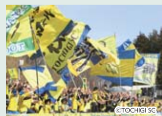
サポーターで埋め尽くされたスタジアム

見どころ 広いフィールドを縦横無尽に行き交うボール、ゴールが決まると会場の盛り上がりは最高潮に達します。試合に勝つと、選手と観客が一体となって「県民の歌」を合唱します! ホームゲームに足を運び、みんなで「県民の歌」を歌いましょう!! 地域貢献 県内各地でサッカー教室や選手・スタッフによる講演活動を行うほか、シニア向け、女性向けに健康教室等を開催しています。また、地域のイベントに参加するなど、地域に根ざした活動も行っていきます。 お知らせ 年内開催のホームゲーム 10/6(日)、20(日)、11/10(日) いずれも会場は県グリーンスタジアム(宇都宮市) 問 (株)栃木サッカークラブ ☎028-600-5555