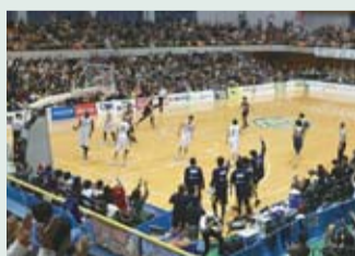
大勢のファンが集まるアリーナ

見どころ 攻守の切り替えが早くスピード感あふれる試合展開、約3メートルの高さのゴールに直接ボールを叩き入れるダンクシュートは迫力満点です。また、試合の合間には会場を巻き込んだ応援パフォーマンスが行われ、チアリーダー「BRÉXY」による華麗なチアダンスは必見です! 地域貢献 小中学生向けのバスケット教室や学校訪問を行うほか、ブレックス・スマイルアクションとして、地域の清掃活動や植樹活動への参加、選手達による子ども医療センター訪問などの取り組みを行っています。 お知らせ 年内開催のホームゲーム 10/6(日)、26(土)・27(日)、11/2(土)・3(日)、16(土)・17(日)、23(土)・24(日)、12/14(土)・15(日) 会場は県立県南体育館(小山市)ほか 問 (株)リンクスポーツエンターテインメント ☎028-637-8132