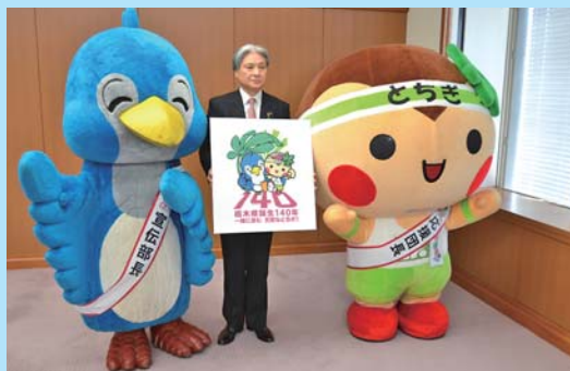
ロゴマークを手にする福田知事。宣伝部長に任命された「ルリちゃん」(左)と応援団長に任命された「とちまるくん」(右)

今年の6月15日は、栃木県と宇都宮県が合併し、おおむね現在の栃木県になった明治6年6月15日から140年目にあたることから、県民の日記念イベントを盛大に開催するなど、年間を通じて本県の元気を県内外に発信していくことを目指します。