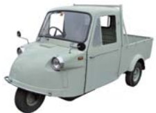
ミゼット

●6/16(日)まで ●欲しい物は何でも手に入る現代の生活と比べて、昔は不便なところもたくさんありました。時には助け合い、励まし合い、家族だけではなく、地域の人々との間で強い絆で結ばれていた昭和のあの頃... ●今回の企画展では、昭和の時代に使われた懐かしい道具や風景を紹介します