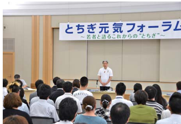
とちぎ元気フォーラム青年版(県庁)

県では、県民参加による開かれた県政の実現に向けて、県民の皆さんの意見やニーズを把握し県政への反映を図る広聴活動や、県政に関するさまざまな情報の積極的な発信により県民の皆さんとの情報の共有化を図る広報活動を展開しています。今回はそれらの事業の中から、知事との対話集会や広報紙、テレビ番組、ホームページなどについて紹介します。