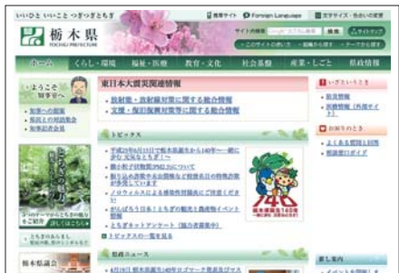
県公式ホームページのトップページ

県の施策やお知らせ、観光情報などさまざまな県政情報を掲載していますので、インターネットを通じて必要な情報をいつでも調べることができます。また、ツイッターを利用して、新着情報などの発信も行っています(ツイッターアカウント @pref_tochigi)。