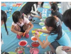
アートラウンジさくら塾

◎親子のための美術鑑賞教室 ●11/17(日)、H26/2/16(日) ●要予約