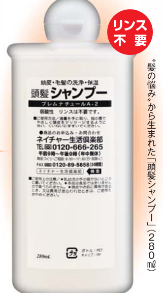
「髪に悩む」から生まれた「頭髪シャンプー」(2800ml)

「頭髪シャンプー」 「毛髪ローション」 「頭皮養毛料」 この3点の無料「試供品」を希望者全員にプレゼント!