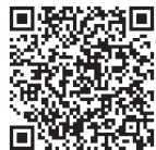
県民の歌ダウンロードQRコード

観光スポットや県産品の紹介など、とちぎの魅力動画を動画で見ることができる「インターネット放送局」や、「県民の歌」の携帯電話・スマートフォン用着信メロディのダウンロードもできるモバイル用ホームページなど、充実した内容です。