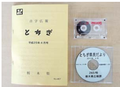
点字広報誌「とちぎ」(左)と声の広報「とちぎ」のカセットテープ(上)、点字版CD(下)

昭和54年の創刊以来、県政の情報を全般的に扱う広報紙として、県内の各家庭にとちぎの旬な情報をお届けしています。県政の話題やとちぎの魅力などを、イラストや写真を交えてわかりやすく紹介する特集や、募集や試験、催しなどの県からのお知らせ、知事コラム「吹き竹」など盛りだくさんの内容です。気になる情報にチェックをつけて、後から確認したり、持ち歩いたりでき、見やすさや使いやすさも魅力です。