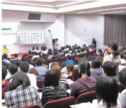
大学生版の様子(文星芸術大学)

県民の皆さんの県政に関するさまざまなご意見やご提案を知事がお聴きし、県の施策に反映していきます。会場では、ふるさと「とちぎ」をもっと元気にするための活発な意見交換が行われており、これまでに75回開催し、8,800人以上の方にご参加いただいています。