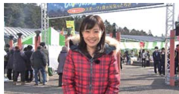
現地からのレポートもお届けします

5月の放送では、脳卒中の初期症状を見逃さないための注意点や、ますます巧妙化する悪質商法の最近の手法とその対策などについて説明します。日曜朝の家族のだらんの時間などに、ぜひ、ご覧ください。