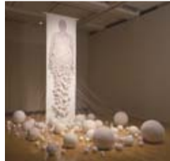
リン・ティエンミャオ 中国(卵#3)2001 福岡アジア美術館蔵

☎028-621-3566 1/3・4・7・15～25・28 ◎県立美術館40周年記念企画「アジアをつなぐー境界を生きる女たち1984-2012」 ●1/26(土)～3/24(日) ●アジアの女性アーティストに焦点を絞った日本初の大規模展覧会 ●パキスタン、インド、バングラデシュ、中国、台湾、韓国など、日本を含めた16カ国・地域の48人による、約110点の作品でアジアの今を紹介いたします リン・ティエンミャオ 中国(卵#3)2001 福岡アジア美術館蔵