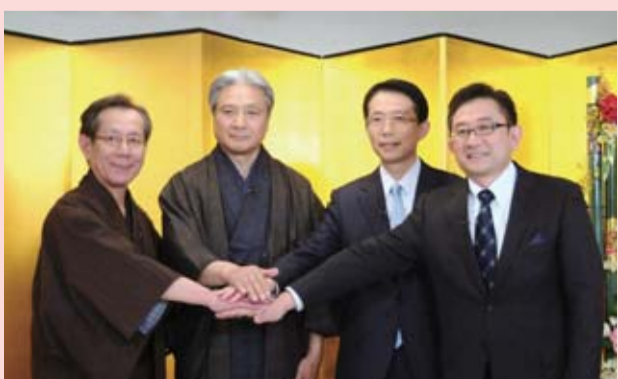
これからも連携して栃木県の魅力の発信と観光誘客に取り組みます

この内容は県広報番組の対談を要約したものです。司会はとちぎテレビ 若林 育 アナウンサー