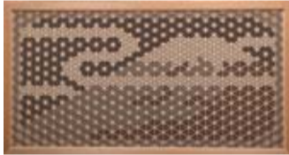
鹿沼組子壁掛け(富士山) 吉原幸二 作

☎028-634-1311 月曜日(祝日の場合は翌日)、1/3・4 ◎テーマ展「栃木の手仕事～木のめぐみ～」 ●1/12(土)～3/31(日) ●本県には益子焼や結城紬など全国に知られた工芸品があります。本展では、そのなかでも鹿沼組子や日光彫など木を利用して作られた作品を紹介いたします 鹿沼組子壁掛け(富士山) 吉原幸二 作