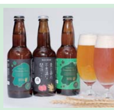
栃木県庁ビール ブランドビール「とちぎ」の取り組みの一つとして開発。「おいでよとちぎ館」(宇都宮市本町3-9)や「とちまるショップ」、宇都宮市内の百貨店などで販売

最初、「県庁ビール」という名前はどうかなと思ったのですが、実はこれが効果てきめんでした。非常に人気があるんですよ。