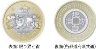
表面：眠り猫と雀 裏面(各都道府県共通)

地方自治法施行60周年記念貨幣の引き換え ●1/16(水)から金融機関の窓口において、栃木県版500円貨幣の額面価格による引き換えが開始されます ●1/17(木)からは、一部の県施設等でも引き換え等を行います