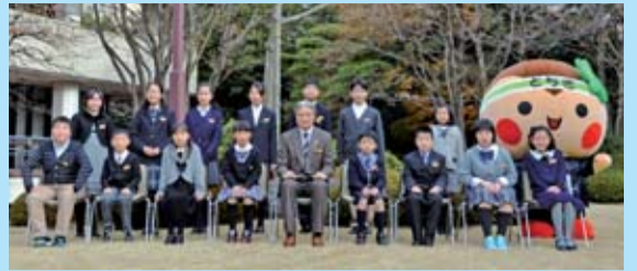
福田知事・とちまるくんと記念撮影する受賞者の皆さん

1,652名の応募の中から15名が表彰を受けました。ふるさと「とちぎ」をもっと元気にしたいという温かく、力強いメッセージがたくさん寄せられました。