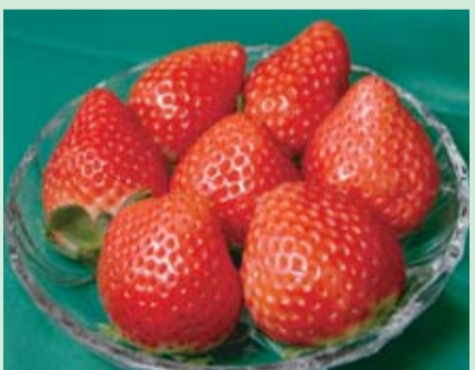
スカイベリー 県が開発したいちごの新品種。現在、都内や県内のデパートなどで試験販売を実施中

とちまるショップができたことで、首都圏と栃木県との心理的距離が縮まった感じがします。お客様に1時間半で栃木県に行けるんですよと云うと、「そんな身近な