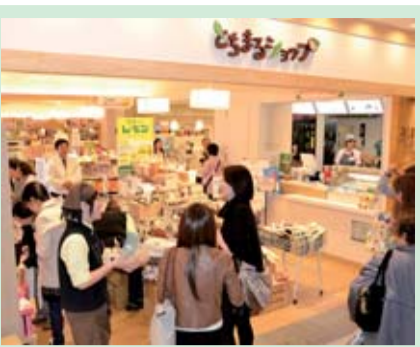
とちまるショップ 県と市町が共同で運営する、本県のアンテナショップ。昨年末で150万人以上が来店

まさに、栃木県の元気な情報を発信する場ですので、多くの方にここに来てとちぎの魅力に触れ、とちぎに来ていただけるとういことを願っています。