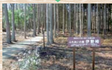
整備された里山林