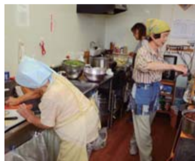
食堂で調理をするボランティアの皆さん

なじみ庵では、運営も高齢者が協力して行います。食堂で「おふくろの味日替わりランチ」を作るのは80歳代の人もいるボランティア。一日4食を作るのは大変ですが、「ごちそうさま」「おいしかったよ」の笑い顔がこぼれます。車での送迎もボランティアが行います。この送迎があるから来ることができるといふ人も多く、欠かせない存在です。