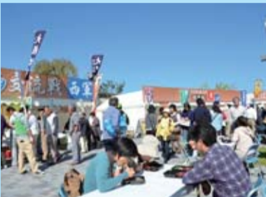
秋晴れの空の下でとちぎのそばを満喫

また、「栃木県伝統工芸品展2012」も同時開催 され、日光彫や真岡木綿など伝統工芸品の製作 実演や展示・販売、伝統工芸士の指導による製作 体験などが行われ、訪れた人はその魅力を十分に 堪能していました。