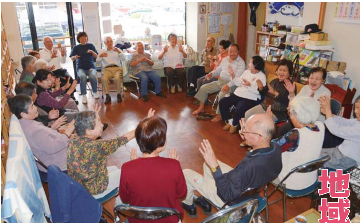
「転ばぬ先の知恵教室」で楽しみながら心と体も元気に／街中サロン「なじみ庵」