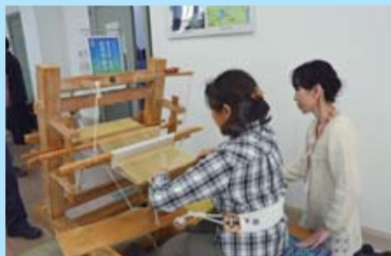
結城紬の機織り体験