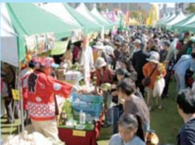
農産物の販売も行われ大勢の人でにぎわいました

「とちぎ“食と農”ふれあいフェア2012」と 「栃木県伝統工芸品展2012」を開催しました(10月20、21日)