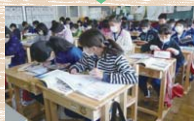
木製学習用机・椅子

間伐材で作った学習用机・椅子を小中学校へ、木製ベンチを公共施設等へ配布しています