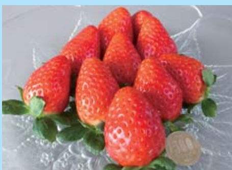
大きな果実、きれいな円すい形、糖度と酸味のバランスが良いスカイベリー

県では、県産いちごの新品種「栃木i27号」の名称を「スカイベリー」に決定しました。大きさが、美しさ、おいしさの全てが大空に届くような素晴らしいいちごという意味が込められています。また、本県にある日本百名山の一つ「皇海山」にもちなんでいます。今年12月から試験販売を開始し、本格出荷は平成26年の冬からです。