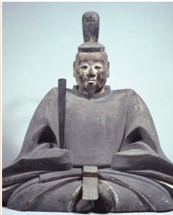
騎馬武者像(国重文・京都国立博物館蔵/左)、足利尊氏坐像(国重文・大分県安国寺蔵/右)