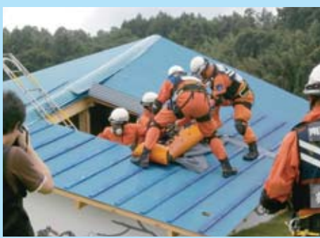
倒壊家屋からの救助訓練

那須烏山市で、県と那須烏山市の共催となる総合防災訓練が行われました。昨年は東日本大震災の対応を優先したことから、2年ぶりの訓練です。震災を踏まえ、警察、消防、自衛隊が連携した捜索・救助等が訓練に取り入れられました。また、列車からの救助や負傷者救護、消火などの訓練も行われ、100団体、約900人が参加しました。