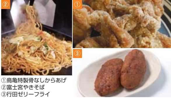
①烏龜特製骨なしからあげ ②富士宮やきそば ③行田ゼリーフライ

ど招待グルメも出展。ドリンクブースでは、県内の地ビールやソフトドリンクも販売します。