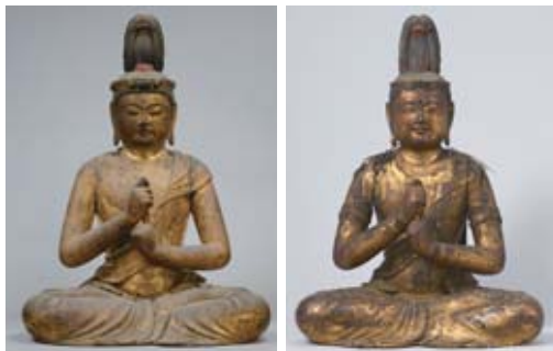
大日如来坐像・国重文 (左)真如苑蔵、(右)光得寺蔵

力士像の作者として知られる運慶の作風をよく表しています。両像は、足利氏の菩提寺であった榑崎寺(足利市)の下御堂と赤御堂に安置されていたと考えられています。