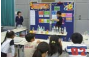
サイエンスショー

☎028-659-5555 月曜日(祝日の場合は翌日)、祝日の翌日 ◎科学まつり●10/27(土)、28(日) 午前10時～午後4時(28日は午後3時30分まで) ●多目的ホール、企画展示室●実験や工作、サイエンスショーなど、子どもたちが楽しく科学にふれあうイベントです