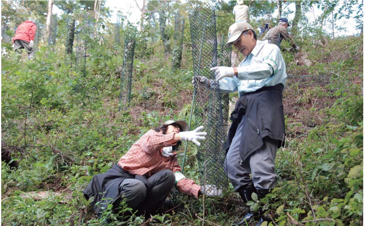
「森の楽校」で森林の空気を味わいながら、苗木の獣害対策ネット設置を体験／矢板市 県民の森

〒320-8501 宇都宮市埴田1-1-20 TEL 028-623-2192 FAX 028-623-2160 栃木県のホームページ http://www.pref.tochigi.lg.jp/