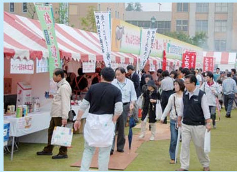
家族連れなど多くの人でにぎわいました

「がんばろう日本! 元気をとちぎの『食』から」をテーマに、県庁および周辺施設で「とちぎ食と農ふれあいフェア2011」が開催されました。 県内各地の新鮮な農産物や、ご当地自慢の食の提供、ステージショーや体験など多数の催しが行われ、訪れた人たちは、秋の味覚を楽しんでいました。