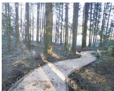
歩道も整備して地域住民に親しまれる森に／塩谷町船生地区

届いていない森林を対象に間伐を実施して、環境の改善を進めています。また、間伐材を暖房の燃料などに有効利用するため、バイオマス資源化を促進しています。