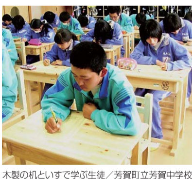
木製の机といすで学ぶ生徒／芳賀町立芳賀中学校

さらには、市や町が実施する、子どもたちの間伐体験などの森林環境学習や、植樹活動への支援など、県民の皆さんが広く森づくりに参加できる機会の提供や、広報活動に努めています。