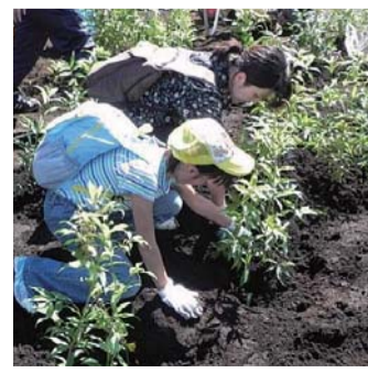
植樹活動／宇都宮市もったいないの森長岡