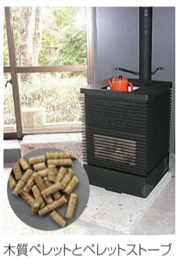
木質ペレットとペレットストーブ

地域の皆さんに親しまれている里山も、手入れをしないと、見通しの悪い暗い森になってしまい、安心安全な地域づくりの支障となるばかりか、イノシシなど