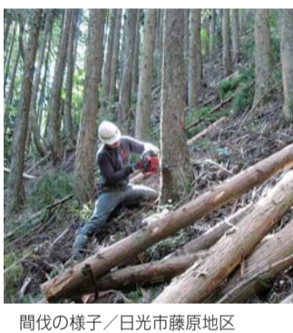
間伐の様子／日光市藤原地区

届いていない森林を対象に間伐を実施して、環境の改善を進めています。また、間伐材を暖房の燃料などに有効利用するため、バイオマス資源化を促進しています。