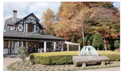
自然あふれる道の駅

地元の新鮮な野菜や卵、乳製品が並ぶファームマーケットがあるほか、レストランではおいしいサンドイッチやオムライスが味わえます。いろいろな種類の焼きたてパンも人気です。 敷地内には、那須野が原開拓者の一人、青木周蔵の那須別邸があり、明治時代の開拓の歴史を見ることが出来ます。 旧青木邸は、明治時代にドイツ公使や外務大臣、駐米全権大使などを歴任した青木周蔵子爵の別邸で、明治21年建築のヨーロッパ式の貴重な近代建築です。