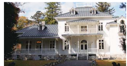
旧青木家那須別邸

～18(日)1泊2日●ダッチオープンを使っての調理活動体験やクリスマスならではの創作活動●対象 県内在住の親子定17組70名程度(抽選)料大人5,800円、高校生4,400円、中学生3,700円、小学生3,500円、3歳以上小学生未満3,200円、3歳未満450円※活動内容により別途料金加算あり ☎11/18(金) 問 同自然の家(那須町) ☎0287-76-6240