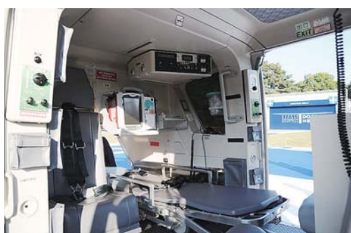
救急医療機器が搭載されたドクターヘリの内部

ドクターヘリとは、救急医療機器を搭載し、救急専門医と看護師が搭乗した救急専用のヘリコプターです。獨協医科大学病院の救命救急センターに常駐し、消防機関からの要請により出動し、救急現場や搬送途中の機内で救命医療を行います。運航エリアは県内全域で、時速200kmで飛行しますので、県内を20分程度で移動することができます。