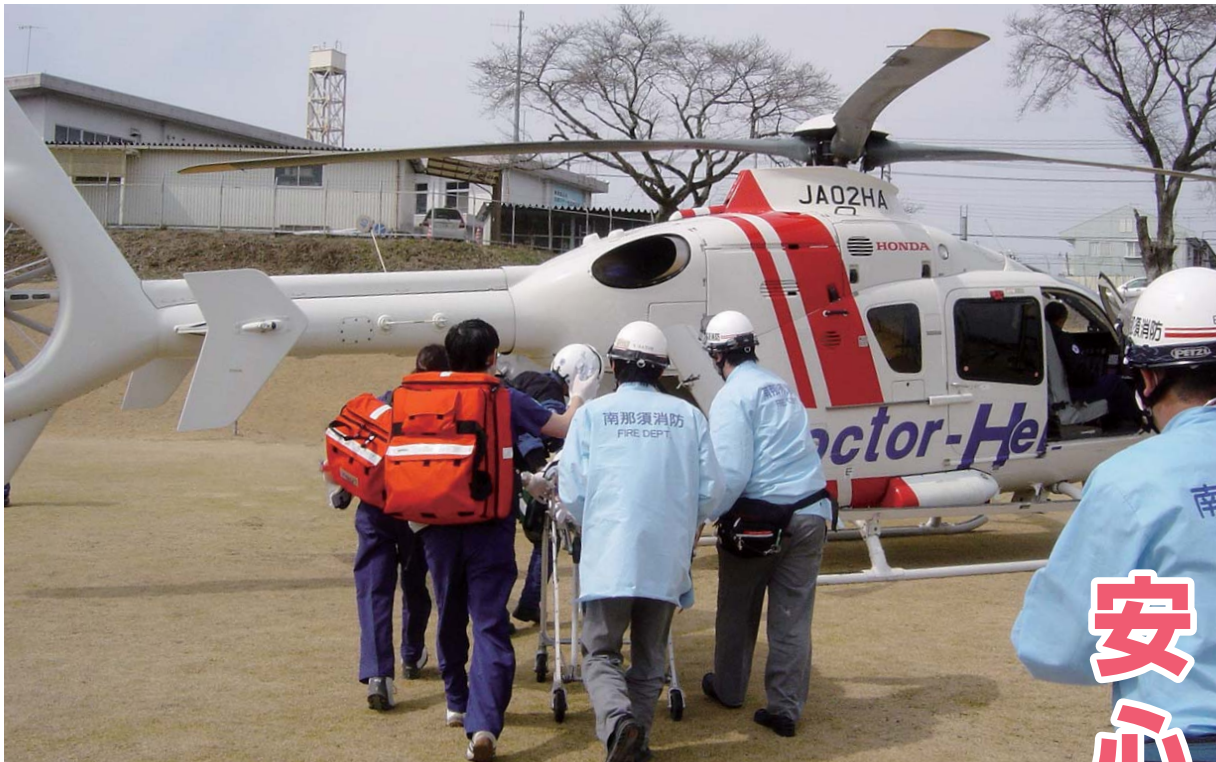
ドクターヘリでの救急患者搬送訓練の様子

〒320-8501 宇都宮市堀田1-1-20 TEL 028-623-2192 FAX 028-623-2160 栃木県のホームページ http://www.pref.tochigi.lg.jp/