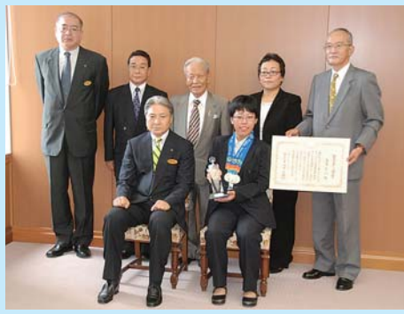
3つの金メダルを胸に、知事と記念撮影する薄井選手