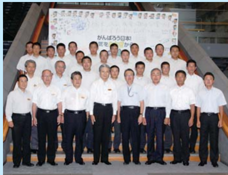
県民ロビーで知事や議長と記念撮影する野球部の皆さん