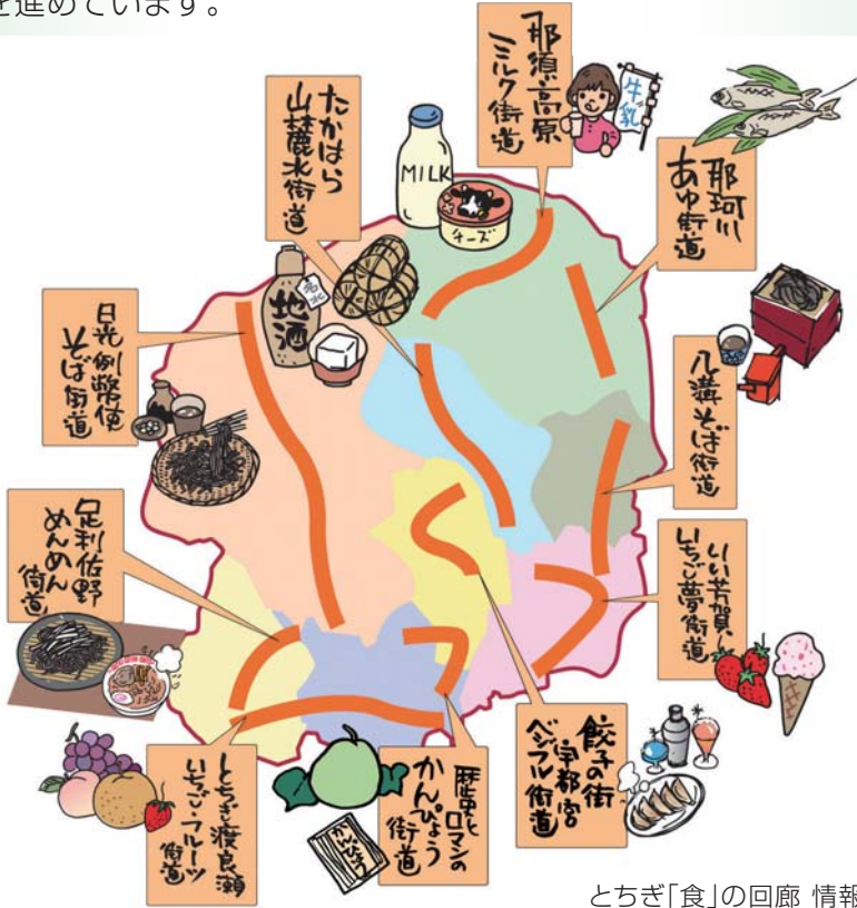
とちぎ「食」の回廊 情報配信中 とちぎ食の回廊 | 検索

栃木県では地域のおいしい食をテーマに、その地域の景観や歴史、文化などを結び付け、「見て」「食べて」「体験する」情報を発信し、訪れる人にふるさとの豊かな食と心から安らぎを感じられる空間を提供しています。10の食の街道では「一度訪れたらまた来てみたい」と感じる食の街道づくりを進めています。