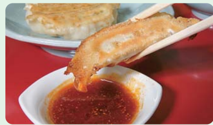
宇都宮は餃子の消費量日本一

宇都宮の食といえば、やっぱり餃子。市内には多くの専門店があります。少し郊外に出れば、農産物の有力生産地として、水稲を中心に、野菜や果樹など多様な農業が展開され、りんごやいちごなどの観光農園では、旬の味を楽しむことができます。夜はトップクラスのバーテンダーが腕を振るうカクテルも魅力。二荒山神社や宇都宮城址公園、大谷石で作られた平和観音など、歴史を感じさせる施設があるのも特徴です。