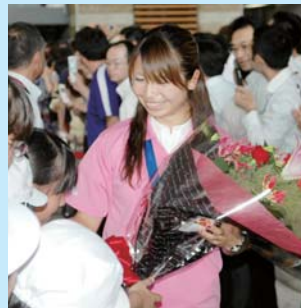
子どもたちと握手をする鮫島選手

7月21日には、本県出身の安藤梢選手と鮫島彩選手が県庁を訪れ、知事にワールドカップ優勝を報告しました。県庁の正面玄関ロビー