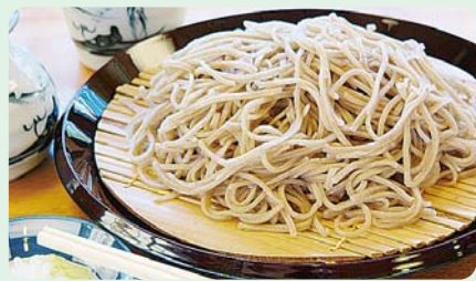
地粉・石臼挽きなどこだわりのそば

日光市、鹿沼市、西方町。日光例幣使そば街道は、日光の社寺や日光杉並木街道。このほか、日光国立公園の自然や温泉など歴史・自然に恵まれたこの地域は、本県を代表するそばの産地でもあります。街道周辺には、日光連山の清らかな空気、水で育まれた自慢のそばを提供する農村レストランや、そば店が多数あります。また、二つとそばが絶妙にマッチした「にらそば」や女性に人気の「そばだんご」なども味わうことができます。新そばの時期には、各地でイベントも開催されます。