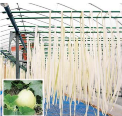
夕顔の実「ふくべ」とかんぴょう作りの様子／上三川町