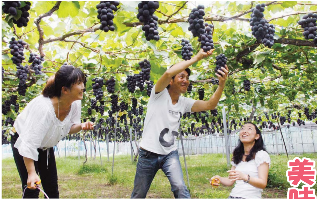
たわわに実ったぶどうを収穫する楽しさはまた格別／大平ぶどう団地