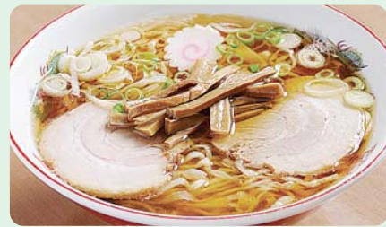
醤油ベースの澄んだスープの佐野ラーメン

足利市、佐野市、栃木市。「足利学校」や「饒阿寺」などを有する県南の観光地で、麦の生産が盛んな地域です。青竹打ちの麺とコクのある澄んだスープが特徴の「佐野ラーメン」、もっちりとした食感がくせになる「耳うどん」、ジャガイモが良いアクセントとなっている「ポテト入り焼きそば」などの小麦を使ったさまざまな麺が味わえます。また、足利や佐野、出流など、地域により特色あるそばを楽しむこともできる多彩な麺が魅力の街道です。