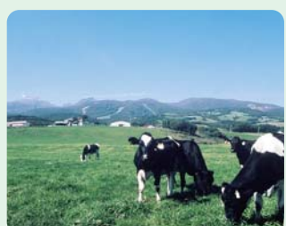
搾りたての生乳から作られた乳製品