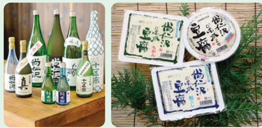
名水から生み出された特産物

日本名水百選に選ばれた塩谷町の「尚仁沢湧水」は、高原山の山麓から湧き出ており、日量65,000リットルと全国有数の湧水量です。その水は天然アルカリイオン水で、冷たく柔らかいのが特徴です。そば、「コシヒカリ」、豆腐や地酒などこの水の恵みを受けた特産物を一度味わってみてはいかがでしょうか。塩谷地域の農産物・特産物が抽選でもらえるスタンプラリー実施中!