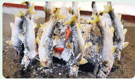
炭火で塩焼きにした天然鮎は味も格別

昔から天然鮎のメッカとして釣り人に愛され、鮎の漁獲量日本一の那珂川。清流に育まれた天然鮎は、塩焼きや鮎めしで「香魚」と呼ばれる独特の香りを楽しむことができます。良質な水で生産される農産物も味が良いと評判です。那珂川に沿って走る国道294号には、「奥の細道」に代表される名所、古所が多数存在するほか、「ながわ水遊園」や道の駅などの交流施設も充実しており、食・歴史・観光などの魅力があふれる街道です。