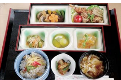
花みどりご膳／とちぎわんぱく公園内レストラン

「問合せ」県農村振興課 028-623-2333 から、歴史を探索する小さな旅に出かけてみてはいかがでしょう。