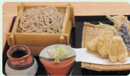
香りが自慢の八溝のそば

寒暖の差が大きい中山間地域で培われ、香り高い八溝のそばとして親しまれてきました。自家製粉している店も多く、挽きたて、打ちたての味と香りを楽しめます。オーナー制のゆず園や、北限と言われるみかん園などの観光果樹園、観光やなで味わう那珂川の鮎など、四季折々の「食」を楽しむことができます。街道で