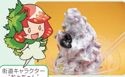
街道キャラクター「おとちゃん」 夏ベリージェラート

芳賀地区はいちごの生産量日本一。甘い果汁が口いっぱいにひろがる果実はもちろん、それぞれのお店が工夫を凝らしたお菓子やアイス、お酒などの加工品もおすすです。「道の駅にのみや」では、県いちご研究所が開発した夏秋いちごの新品種「なつおとめ」と地元産ブルーベリーがコラボした「夏ベリージェラート」が好評です。