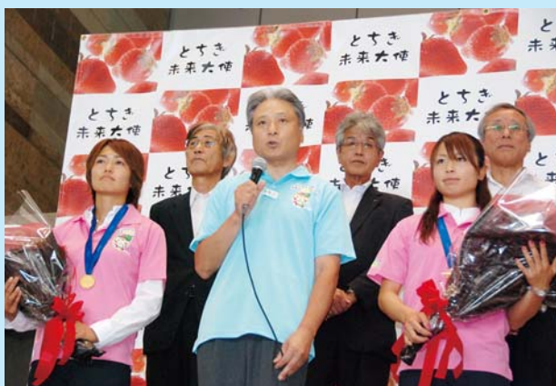
集まった人々を前に、知事から紹介を受ける安藤選手(左)と鮫島選手(右)