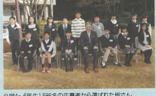
小学4～6年生1,586名の応募者から選ばれた皆さん