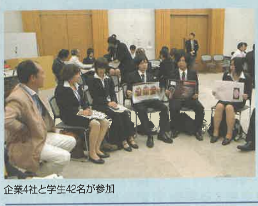
企業4社と学生42名が参加

◎けんちょうde愛ふれあい直売所 ●1/18(火)午前10時～午後2時 ●会場 本館1階県民ロビー、昭和館前庭 ◎次回のマロニエ県庁コンサート ●2/8(火)午後0時10分～50分 ●会場 本館1階県民ロビー ●出演者 篠崎加奈子 ●内容 声楽(ソプラノ) ◎県庁舎の閉館日 ●1/3(月)・15(土)・16(日)・2/13(日) 栃木県メールマガジン「つぎつぎ”とちぎ”メール」読者募集 [http://www.pref.tochigi.lg.jp/merumaga/]