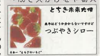
とちぎ未来大使 来年はどうか分からないですけど つぶやきシロー