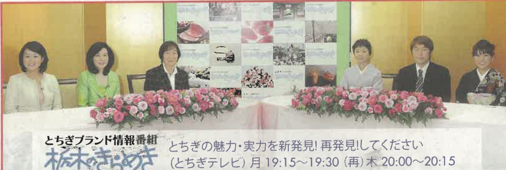
とちぎブランド情報番組 栃木のきらめき とちぎの魅力・実力を新発見! 再発見! してください (とちぎテレビ) 月 19:15~19:30 (再) 木 20:00~20:15