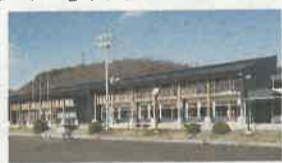
茂木町立茂木中学校

●11/10(水) 県庁東館4階講堂 ●表彰式(午後1時30分~)、記念講演会「景観づくりと都市デザイン」(午後2時20分~) ◎県都市計画課 ☎028-623-2463 ◎県建築課 ☎028-623-2512