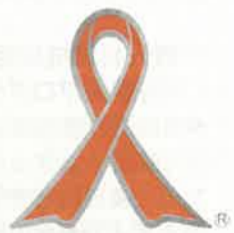
子ども虐待防止 オレンジリボン運動