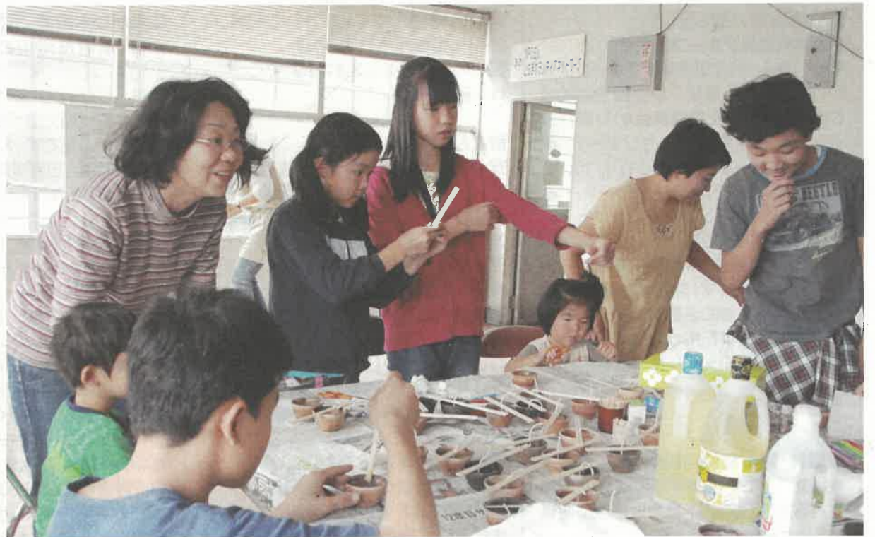
「子ども虐待をなくそう!」県民のつどいのキャンドル作りボランティア

昨年度、寄せられた児童虐待相談件数は、市町と県児童相談所あわせて千二百七十七件で、これは過去最も多件数でした。虐待者は実母が五十五%、実父とあわせると八十八%が実父母です。また就学前の児童に対する虐待が四十五%を占め、小学生に