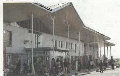
小山市の姉妹都市オーストラリア・ケアンズ風の明るく開放的な建物

ワイワイ広場は遊具が備わり親子連れでも遊べるほか、さまざまなイベントも開催されており、大人から子どもまで楽しめる道の駅です。