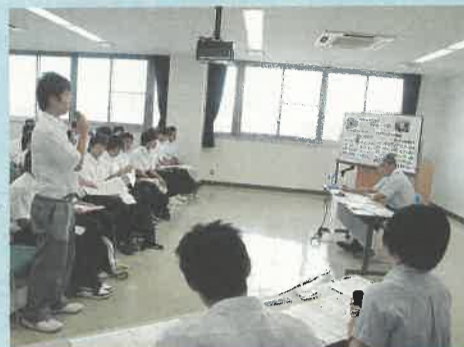
知事と意見交換する高校生

七月二十日、県総合文化センターで、とちぎ「食」の産業フォーラムを開催しました。これは、本県の豊富な農産物や水などを活用して、食に関連する幅広い産業が連携することで、地域経済が成長・発展し、活力あふれる「フードバレーとちぎ」を目指して開催したものです。今後の「食」の産業振興策について、活発な意見交換が行われました。