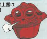
なす風土記のキャラクター 「ドキオ」