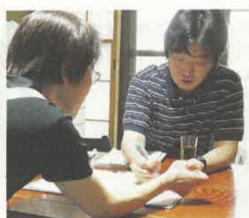
耐震診断前に図面を確認しながら入念な打ち合わせ

無料の簡易耐震相談や耐震アドバイザーの意見などで、建築士の正式な耐震診断を受ける場合は、県内すべての市町で耐震診断費用の助成を受けることができます。