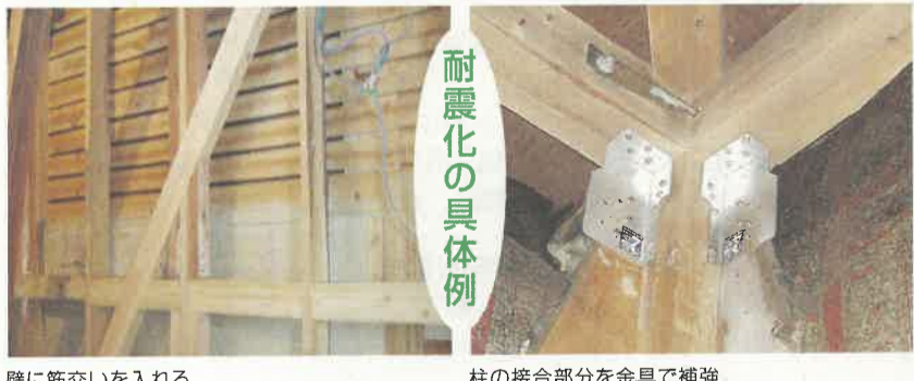
壁に筋交いを入れる 柱の接合部分を金具で補強

あなたのお住まい 地震への備えは大丈夫？ 昭和五十六年六月以降の新しい耐震基準で建てられた住宅は、阪神・淡路大震災などで被害が少なかったことが確認されています。昭和五十六年五月以前の住宅にお住まいの方は、耐震化についてお考えください。