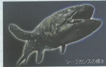
シーラカンスの標本

●バックヤードツアー 水族館の裏側を見学 9/5(日)まで毎日開催 ●開催時間 午前11時10分～11時50分 (受付は午前10時～) ●受付 インフォメーションカウンターにて ●定員 各日先着10名 ●参加費 無料(要観覧チケット)