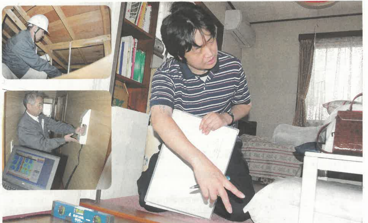
床の傾きや屋根うら、壁の中などを調査／建築士による耐震診断