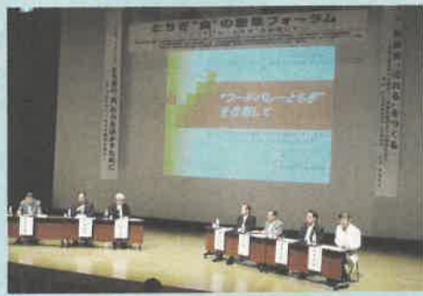
「とちぎの“食”の力を活かすために」をテーマにパネルディスカッション