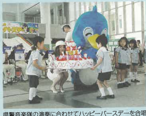
県音楽隊の演奏に合わせて「ハッピーバースデー」を合唱