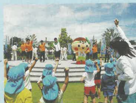
とちまるくんと一緒にダンスをする子どもたち

県民の日の六月十五日、県庁で記念イベントを行いました。県産農産物等の直売やコンサートなど、たくさん催し物が開催されました。県民の日のマスコットキャラクター「ルリちゃん」の誕生会も行われ、作新学院幼稚園の子どもたちが作った紙製のケーキなどがルリちゃんにプレゼントされました。