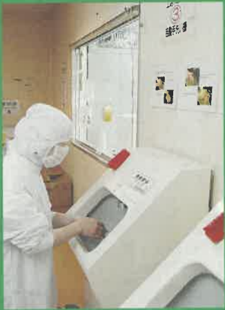
マニュアルに基づいて入念な手洗い