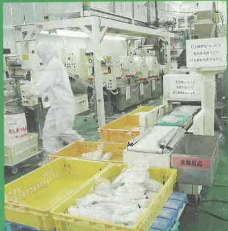
重量の計測と金属異物がないかを自動的に検査して選別