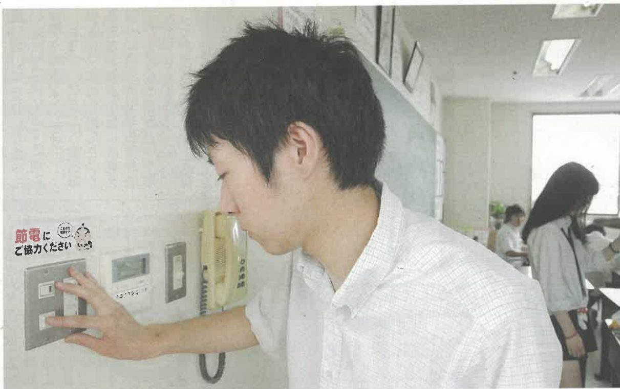
省エネのためお昼休みに消灯/国際情報ビジネス専門学校高等課程