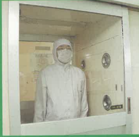
製造エリア入口にあるエアシャワーで衣服に付着したごみや毛髪を除去