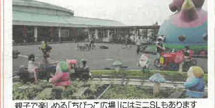
親子で楽しめる「ちびっこ広場」にはミニSLもあります

「どもんなかたぬま」というユニークな駅名は、佐野市内に日本列島の中心地があることに由来しています。 佐野ラーメンや、いもフライなどの佐野名物が味わえるほか、本格中華料理の店も人気をよんでいます。 地元の新鮮野菜が購入できる農産物直売所や、佐野市の特産物、どもんなかたぬまオリジナル商品も好評です。 さまざまなイベントも人気で、7/24(土)～8/29(日)の期間は、恒例のお化け屋敷が開催されます。