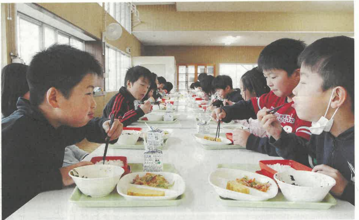
学校給食での食育「ヒジキの煮物もおいしいよ!」/那珂川町立小川小学校にて

編集・発行 栃木県広報課 平成21年12月15日発行 2面 とちぎ産業振興プロジェクト・地デジ化 3面 県からのお知らせ・とちぎのプロスポーツ 4面 吹き竹・県政トピックス・文化情報 ほか 〒320-8501 宇都宮市瑞田1-1-20 TEL 028-623-2192 FAX 028-623-2160 栃木県のホームページ http://www.pref.tochigi.lg.jp/