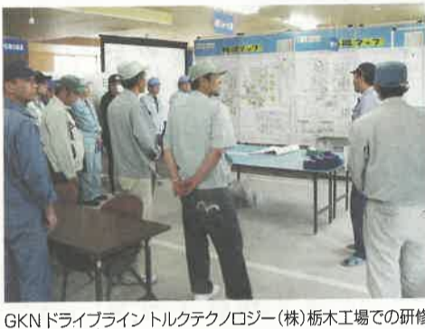
GKNドライブシャフトテクノロジー(株) 栃木工場での研修

自動車産業は、よりクリーンな次世代自動車の開発が活発化し百年に一度といわれる転換期を迎えています。