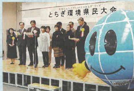
足利市立葉鹿小学校の児童による「エコとちぎづくり県民宣言」

十一月三十日、県民の皆さん一人ひとりに、より一層の交通安全と防犯意識を高め、県民総ぐるみで安全で安心なまちづくりをすすめるため、宇都宮市文化会館で「栃木県交通安全生活安全安心県民大会」を開催しました。大会では、交通安全対策功労者や安全で安心なまちづくり功労団体の表彰などを行い、最後に「大会宣言」が採択されました。