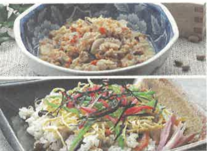
郷土料理の代表「しもつかれ」/上 年中行事・特別な日のごちそう「五目めし」/下

とちぎの伝統的な食文化を受け継ぎ、発展させていくため、県では、郷土料理のいわれや作り方を紹介した「ふるさと」の味とちぎの味などの資料を作成し、普及啓発を行ったり、地域の食材を活用した「とちぎ健康料理」を選定したりして、普及に努めています。