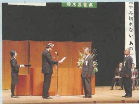
知事から表彰された関係者の方たち

十一月三十日、県民の皆さん一人ひとりに、より一層の交通安全と防犯意識を高め、県民総ぐるみで安全で安心なまちづくりをすすめるため、宇都宮市文化会館で「栃木県交通安全生活安全安心県民大会」を開催しました。大会では、交通安全対策功労者や安全で安心なまちづくり功労団体の表彰などを行い、最後に「大会宣言」が採択されました。