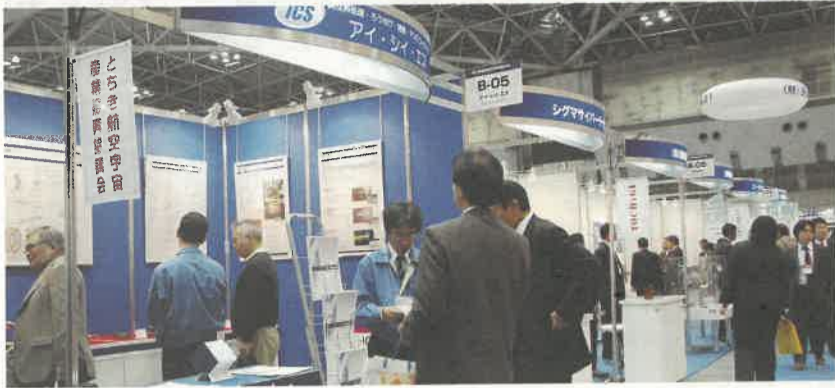
東京ビッグサイトで先月4～6日の3日間開催の東京国際航空宇宙産業展2009。全国から286社・団体が出展