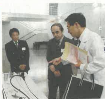
企業独自の製品や得意技術を医師に説明

本県の医療機器産業は生産額全国一位を誇り、優れた技術を持つ企業が集まっています。とちぎ医療機器産業振興協議会では振興策の一つとして先月18日、医療関係者と会員企業との技術情報交流会を獨協医科大学で開催しました。企業が自社の技術・製品を展示・説明したり、医師の医療機器への要望を紹介したりすることで、新たな製品の開発に役立てようという重要な役割を果たしています。参加した企業は「製品に重要なのは医師との相性。交流会で情報交換することで市場性も把握できます」と話していました。参加した医師は「医療の現場で医療機器がこうであったらいい」という要望は日々たくさんあります。製品化になるまでが難しい。ドクターへリ