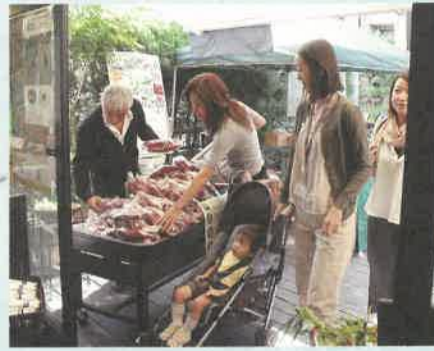
新鮮野菜や加工品など約70種類を販売しました

本県の風土と生活の中からはぐくまれ、受け継がれてきた伝統工芸品を一堂に集め広く紹介する「栃木県伝統工芸品展2009」が十月九日、十日の二日間、県庁で開催されました。 高度な技術・技法を保持する伝統工芸士がその技を披露する製作実演をはじめ、日光彫や間々田紐、新波の提灯などの体験教室も開催され、大勢の参加者でにぎわいました。