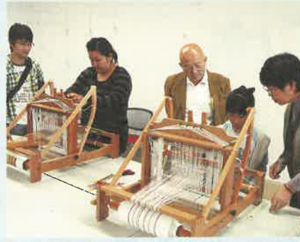
卓上機による真岡木綿のコースター製作体験教室