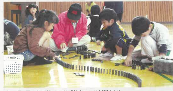
ボランティアの方とドミノたおし「むすかしいけど楽しい!」