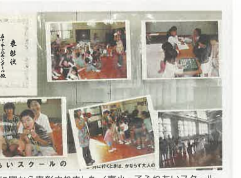
他の模範として今年の2月に国から表彰されました／喜小っ子ふれあいスクール