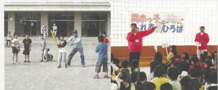
はじまりの会で「きまり」や「ちゅうい」を全員で確認後、校庭などへ移動