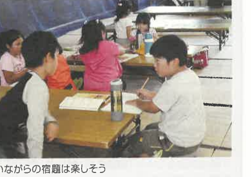
子どもたち同士で教え合いながらの宿題は楽しそう