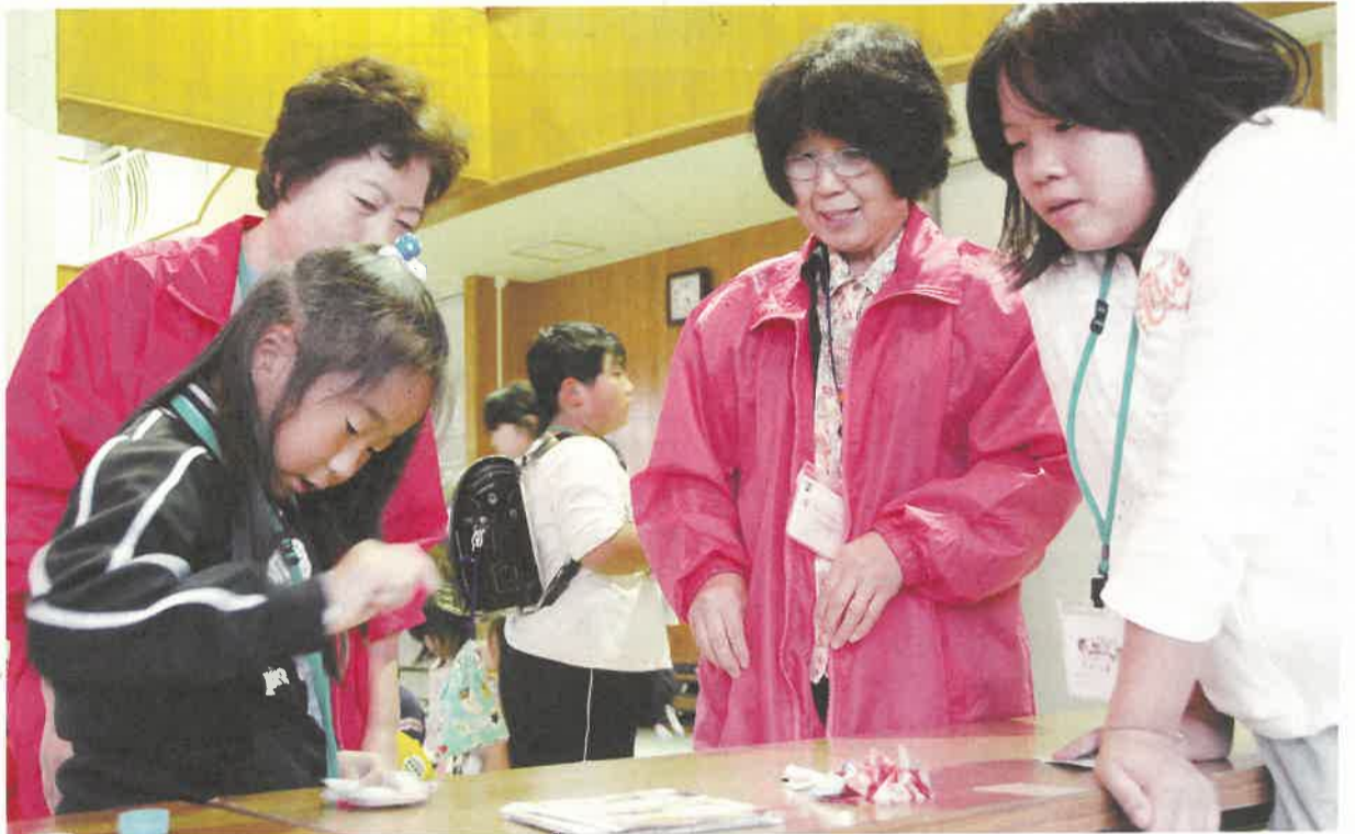
チラシの折り紙でコマ作り／間小っ子ふれあいひろばにて

編集・発行 栃木県広報課 平成21年11月17日発行 2面 児童虐待防止・とちぎ未来開拓プログラム 3面 県からのお知らせ・とちぎのプロスポーツ 4面 吹き竹・県政トピックス・文化情報 ほか 〒320-8501 宇都宮市埴田1-1-20 TEL 028-623-2192 FAX 028-623-2160 栃木県のホームページ http://www.pref.tochigi.lg.jp/